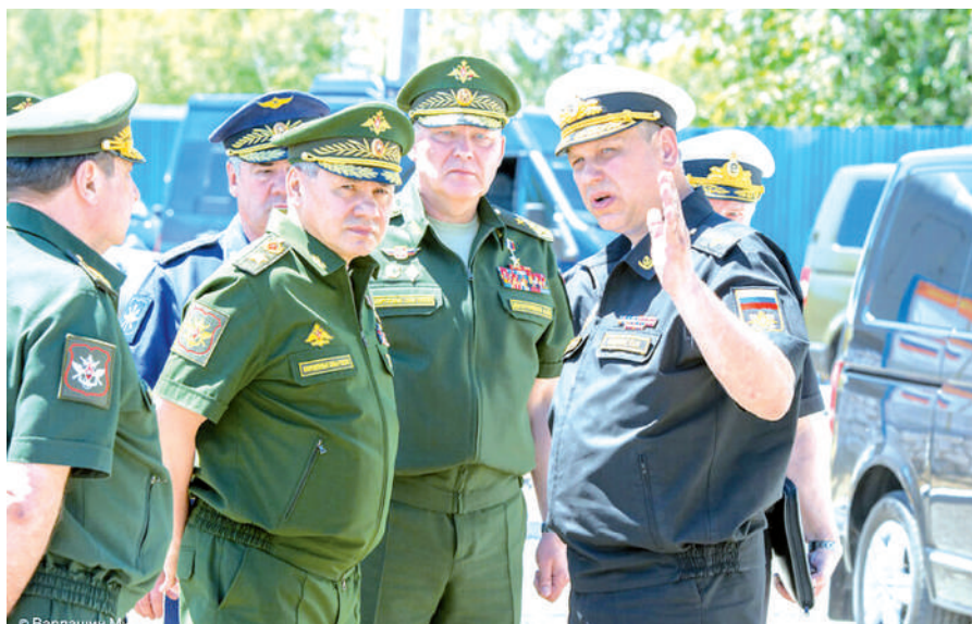
Командующий Каспийской флотилией контр-адмирал Сергей Пинчук предлагает свой вариант.

Сияющая белизной флотская форма. Надраенная рында и добродушно улыбающийся во все зубы боцман. Стоящие на рейде в строгой линии подводные лодки и надводные корабли, расцвеченные множеством флагов, обход их командующим, встреча на флагманском корабле, звуки горна и сияющие на солнце трубы духового оркестра... От силы, мощи, красоты захватывает дух. День Военно-морского флота РФ как праздник установлен Указом Президента России от 31 мая 2006 года № 549. Но изначально праздник был учреждён по предложению наркома ВМФ СССР Адмирала Флота Советского Союза Николая Кузнецова - Постановлением Совета Народных Комиссаров СССР и ЦК ВКП(б) от 22 июня 1939 года.