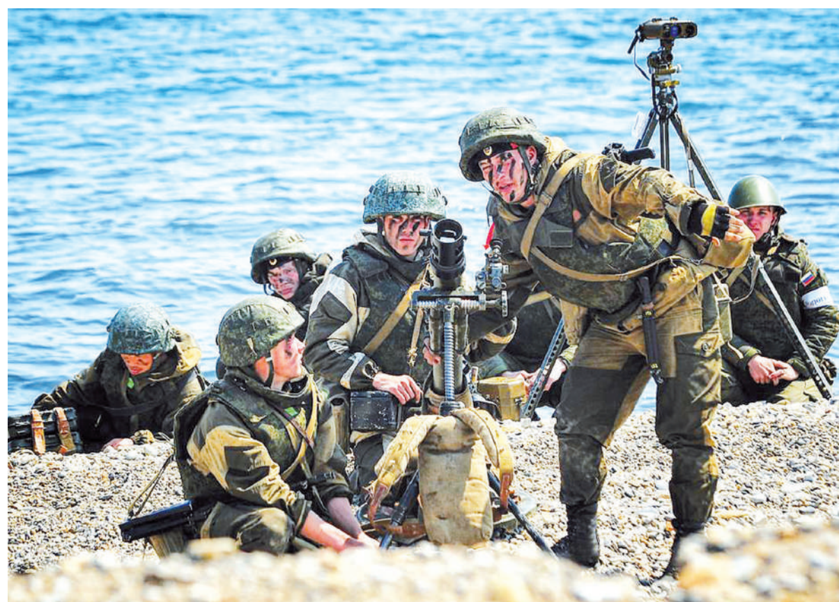
Учение: морская пехота.