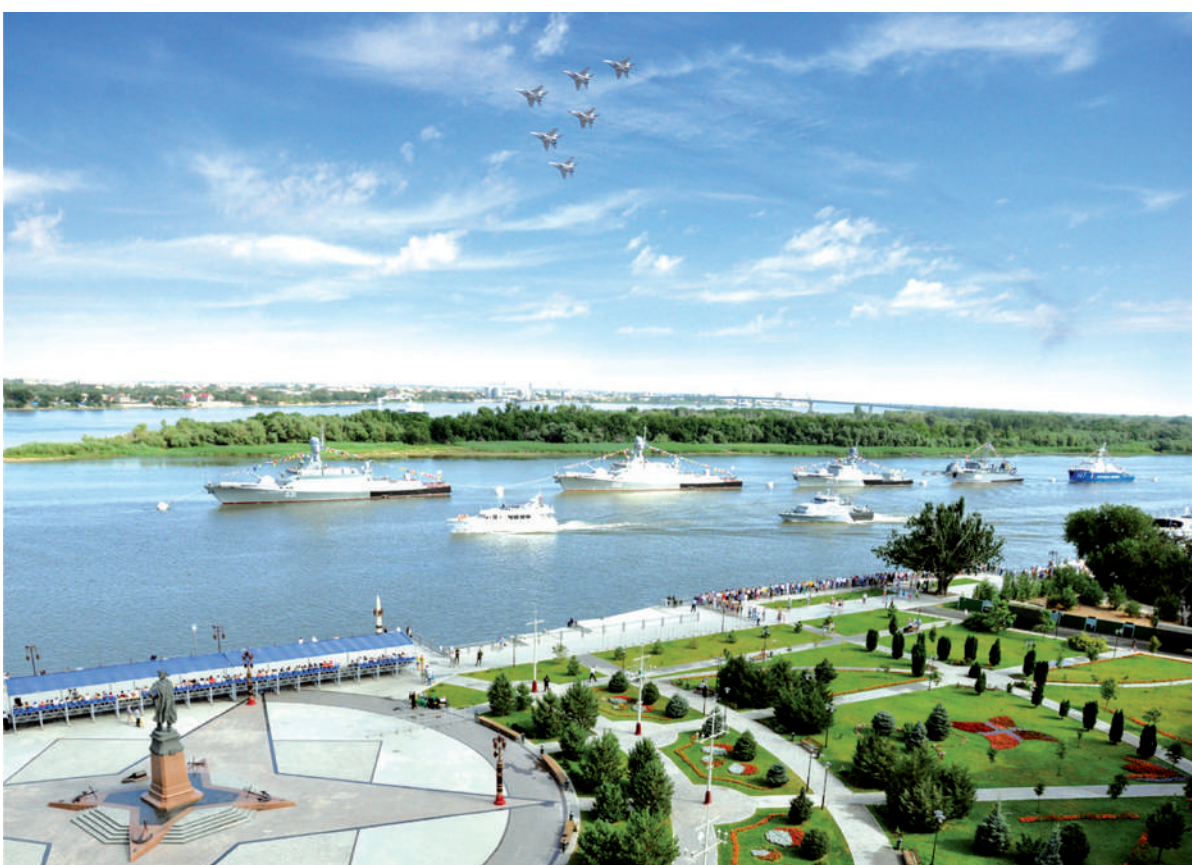
Неземная красота - это воздух и вода.