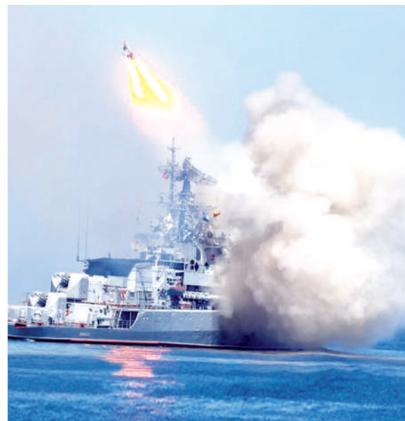
Учение: сторожевой корабль «Ладный».