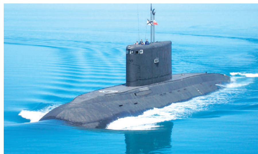
Когда усталая подлодка из глубины идёт домой...