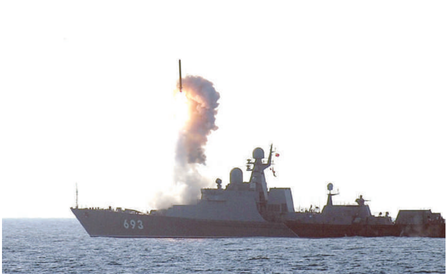
Вот он - пуск ракетный.