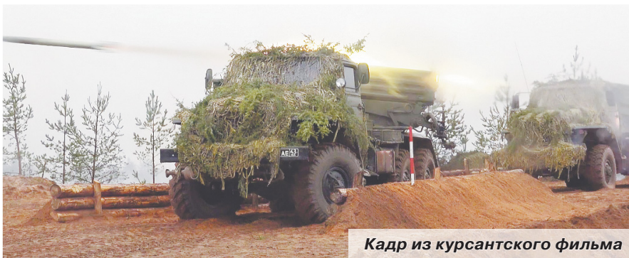
Кадр из курсантского фильма

та была сделана в 2016 году на конкурсе, проводившийся по решению министра обороны. Это был фильм «Артиллерия против коррупции». Он занял первое место и вдохно-