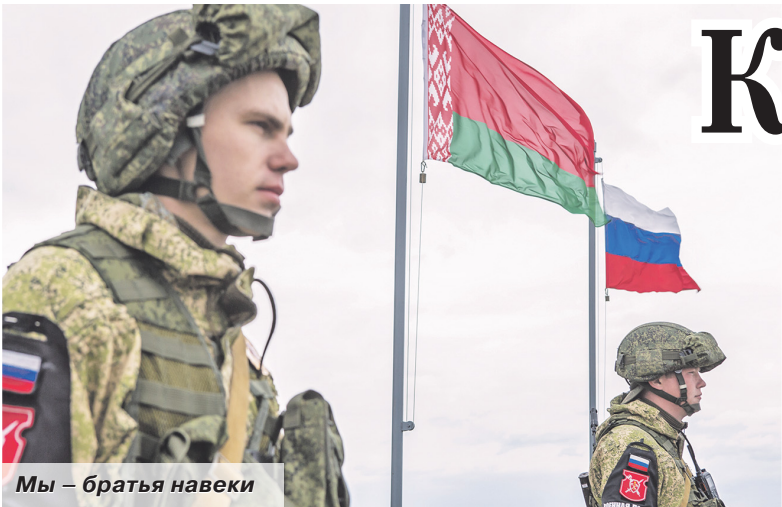
Мы – братья навеки

Главным мероприятием боевой подготовки России и Белоруссии в текущем году станет совместное оперативное учение вооружённых сил двух стран «Щит Союза-2019», которое будет носить исключительно оборонительный характер. Эти манёвры призваны продемонстрировать нашу общую решимость и способность отстоять суверенитет и территориальную целостность Союзного государства.