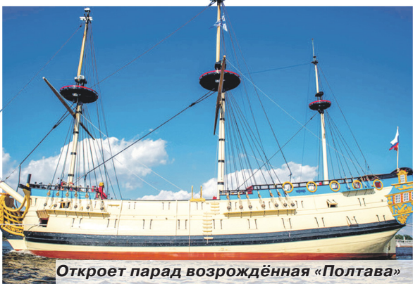
Откроет парад возрождённая «Полтава»

О том, что Главный военно-морской парад летом 2019-го станет более масштабным и зрелищным, заявили в главкомате ВМФ ещё зимой. Тогда же была