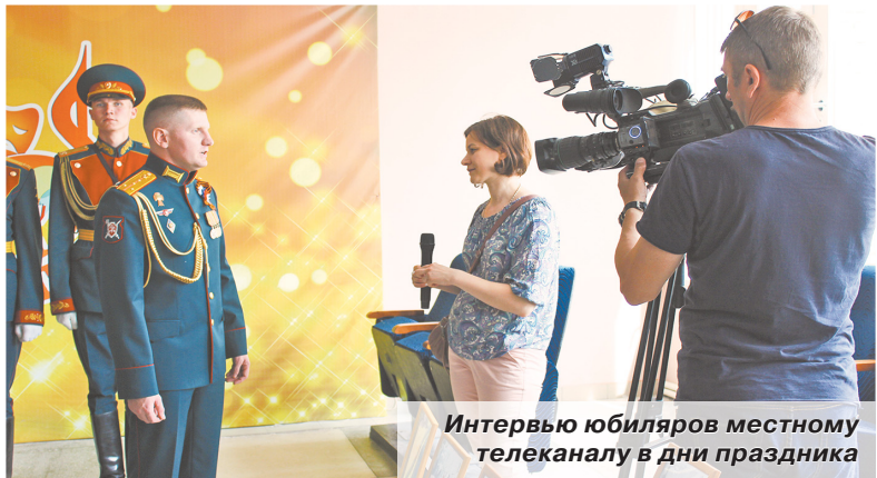
Интервью юбиляров местному телеканалу в дни праздника

1 июня военная комендатура Коломенского местного гарнизона отпраздновала небольшой юбилей – 10 лет со дня образования в Коломенском городском округе. Так совпало, что в этот же день коломенцы чествовали 630 лет со дня благовещения святого благоверного князя Дмитрия Донского.