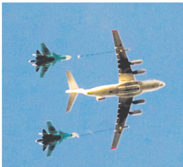
Топливозаправщик Ил-78 и дозаправка в составе пары

Особенностью проведения упражнений по дозаправке топли-