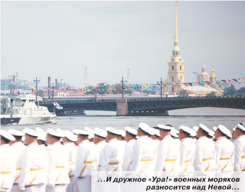
...И дружное «Ура!» военных моряков разносится над Невой...