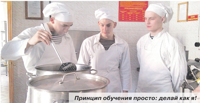
Принцип обучения просто: делай как я!