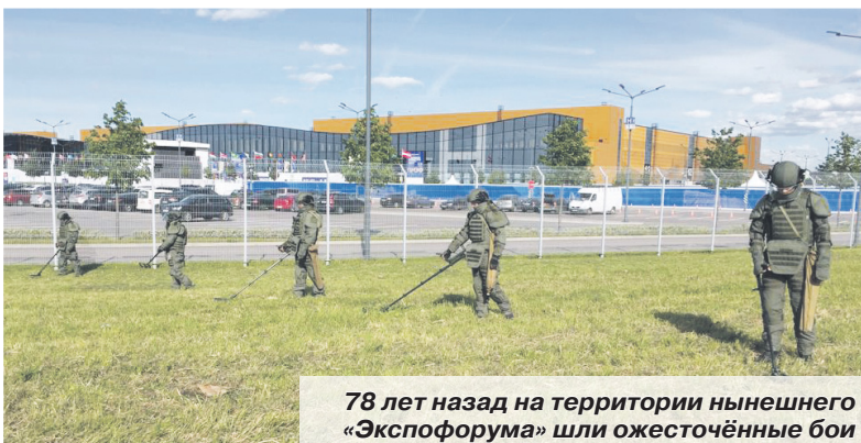
78 лет назад на территории нынешнего «Экспофорума» шли ожесточённые бои

Ольга ВИНУКОВА Санкт-Петербург