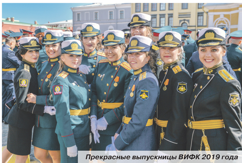
Прекрасные выпускницы ВИФК 2019 года

— Горы сложные, Суворов действительно в свое время совершил подвиг — там тяжёлый климат: днём очень жарко, а ночью — холодно. С точки зрения конкуренции, мы где-то шли вровень со всеми, но нередко были