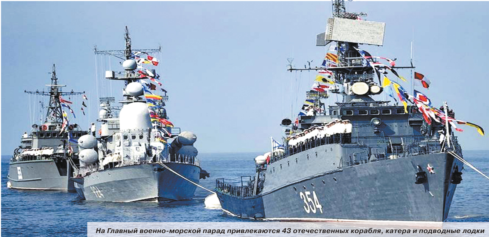
На Главный военно-морской парад привлекаются 43 отечественных корабля, катера и подводные лодки