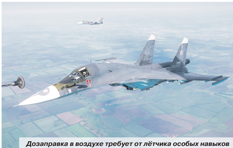
Дозаправка в воздухе требует от лётчика особых навыков

вом в воздухе в этом году стало сближение бомбардировщиков и разведчиков на высоте около 2 тыс. метров в условиях сильного испарения и тряски от воздушных ям, которые проявляются в условиях высокой температуры воздуха — около 40 градусов на солнце. При этом с каждым километром подъёма воздушного борта температура воздуха уменьшается на 6 градусов и достигает 25 градусов, что создаёт перепад плотности воздушных масс.