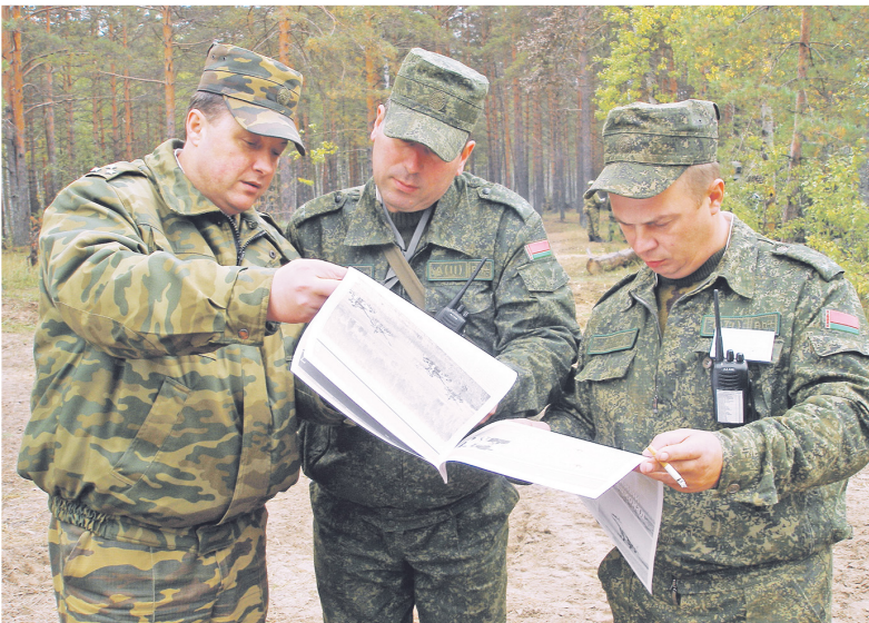
Офицеры братских армий понимают друг друга с полуслова