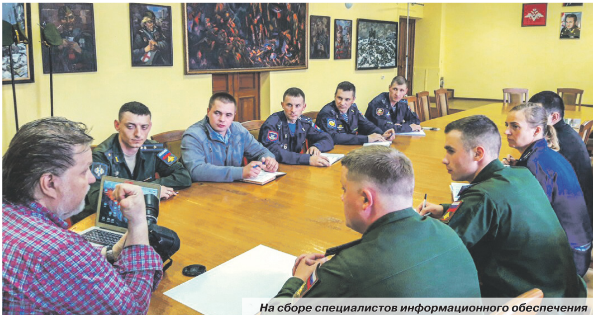
На сборе специалистов информационного обеспечения

ния нормативно-правовой базы в области информационного