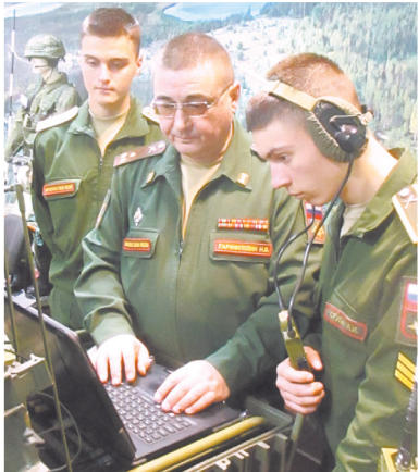
Тишина! Идёт озвучка...

вил группу продолжать работу. В 2017 году военнослужащие сняли 15-минутный фильм «Горячий лёд», в 2018 ещё один – «Музыка артиллерийских залпов». Видеоролик «Цель 101 уничтожить» получил приз за лучший монтаж на конкурсе, проводимом Минобороны.