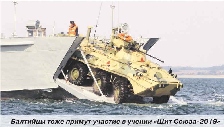
Балтийцы тоже примут участие в учении «Щит Союза-2019»

Недавно проведена рекогносцировка района учения на полигоне Мулино российскими офицерами штаба ЗВО и их белорусскими коллегами под руководством начальников штабов совместного штаба учений. Перед этим мероприятием проводилась совместная командно-штабная тренировка, в ходе которой отработали вопросы взаимодействия и совершенствования системы управления. С 22 по 24 июля рекогносцировка в Мулино пройдёт под нача-