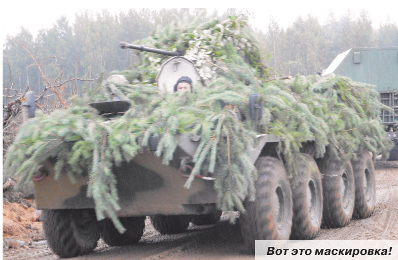
Вот это маскировка!

Основными участниками «драконовских» учений являются военнослужащие 11-й бронекавалерийской дивизии и выделенные подразделения поддержки и обеспечения Войска Польского. Следует отметить, что такое практикуется впервые. Ранее только часть