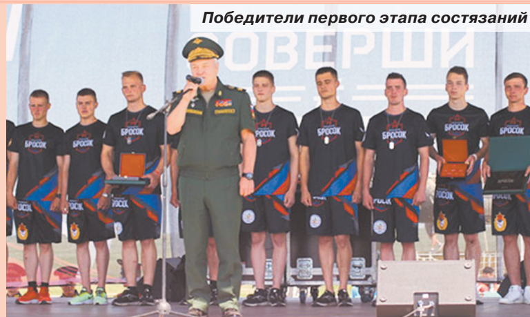
Победители первого этапа соревнований