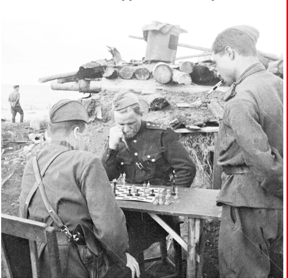
Ход конём в момент затишья.