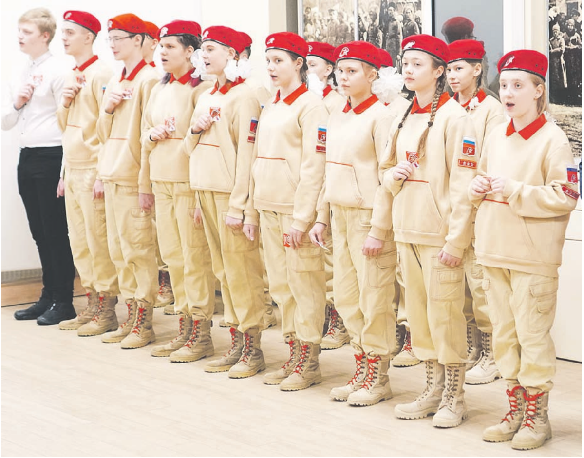
На снимках: церемония принятия в «Юнармию».

- Спасибо за интервью и успехов в вашей работе.