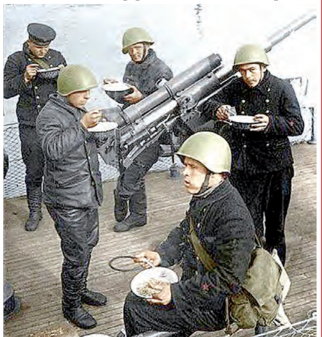
Война войной, а обед - по расписанию.