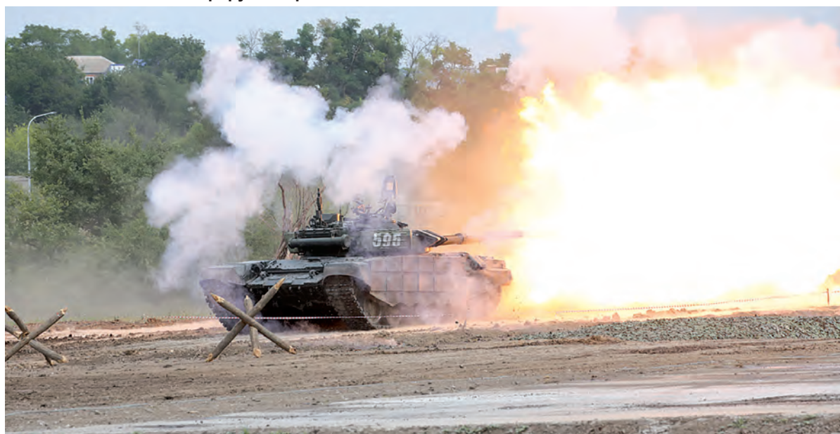
В цель - первым выстрелом! Легендарный танк Т-72-Б3М в деле.