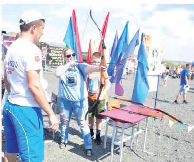
Турнир по стрельбе из лука среди всех желающих.