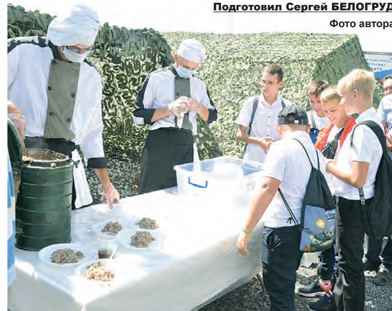
Настоящая «солдатская» гречневая каша для гостей форума.