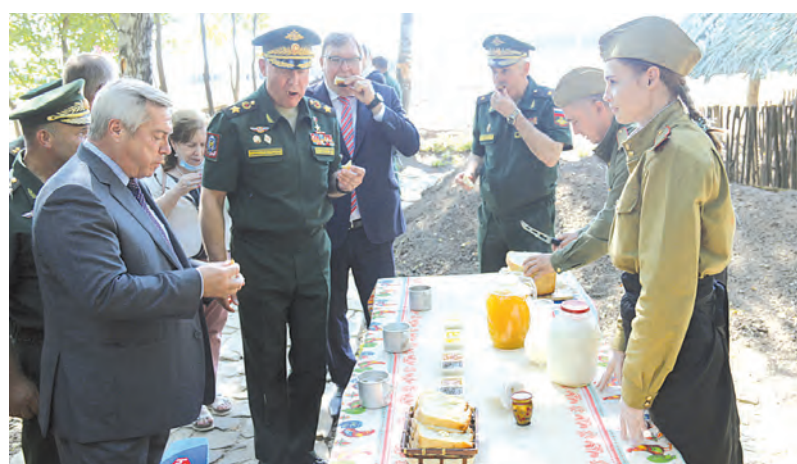
На полевой кухне «партизанской деревни» можно было перекусить.