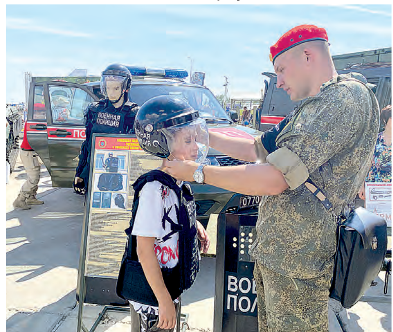
Военная полиция была интересна всем от мала до велика.