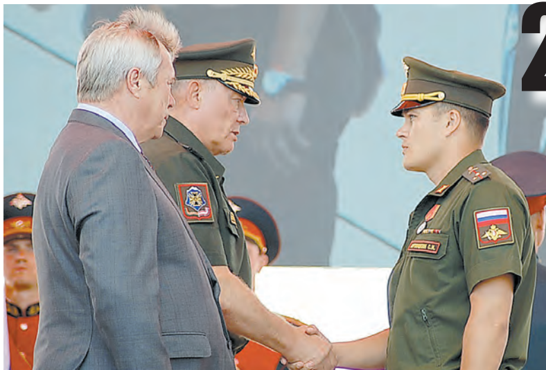
Многие отличившиеся получили награды из рук командующего войсками ЮВО.