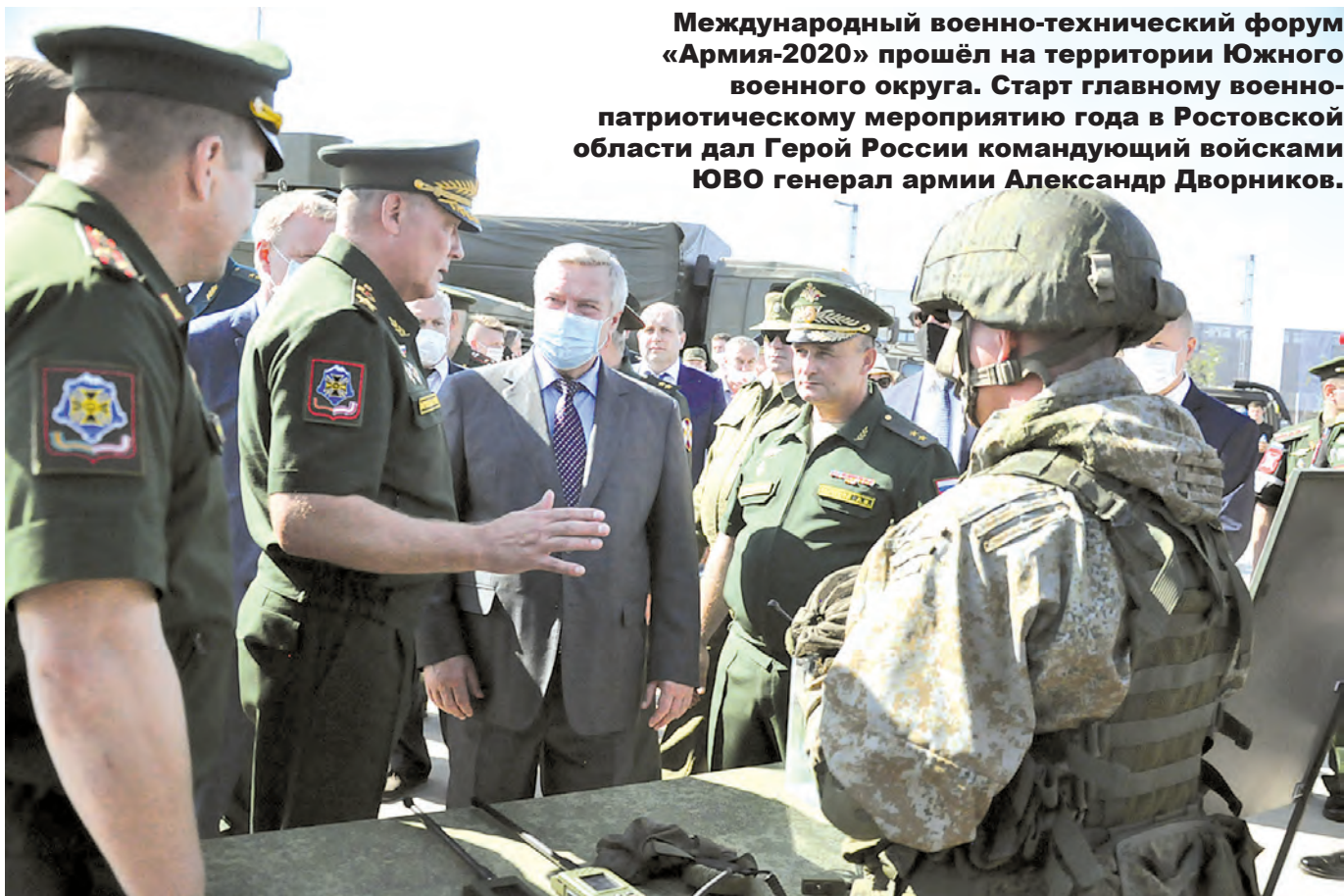
Международный военно-технический форум «Армия-2020» прошёл на территории Южного военного округа. Старт главному военно-патриотическому мероприятию года в Ростовской области дал Герой России командующий войсками ЮВО генерал армии Александр Дворников.

Выставка достижений ВПК и показ ратной выучки военнослужащих в этом году проходили на базе региональных филиалов парка «Патриот». Кроме того, часть демонстрационных пусков прошла на полигоне Ашулук в Астраханской области. Их транслировали в реальном времени на экранах различных площадок форума.