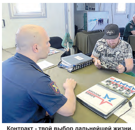
Контракт - твой выбор дальнейшей жизни. В мобильном пункте отбора.