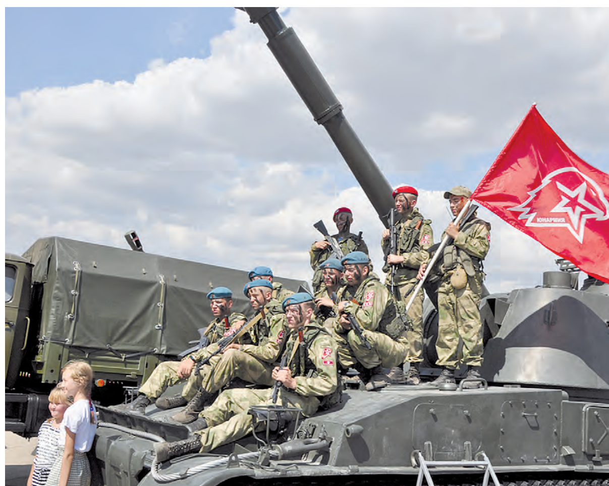
Растёт достойная смена фронтовикам.