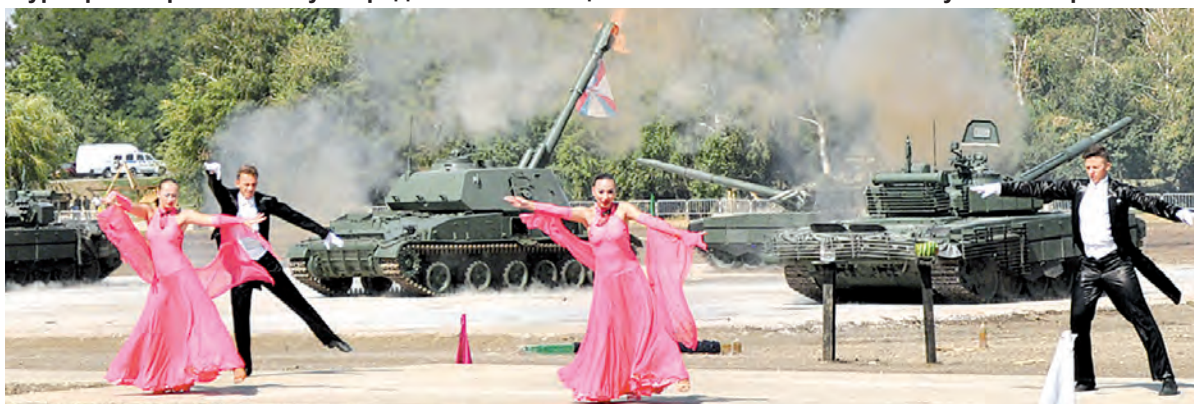
Классический вальс на фоне вальса танкового.