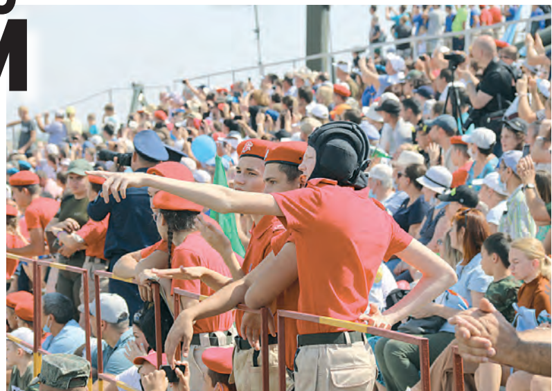
Болельщиков и зрителей было огромное множество.