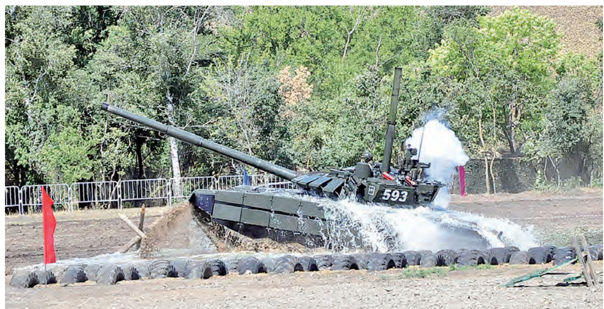
В «бой» - из-под воды.