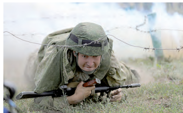
Преодоление препятствия по-пластунски