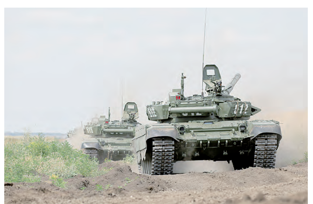
Возвращение на исходную позицию после выполнения учебно-боевой задачи.