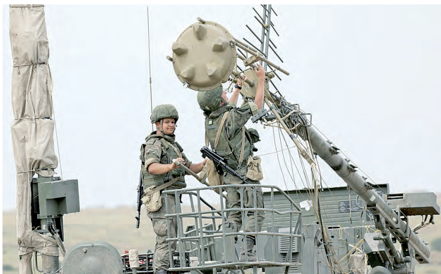
Связь - нерв армии. Нет связи - нет управления.