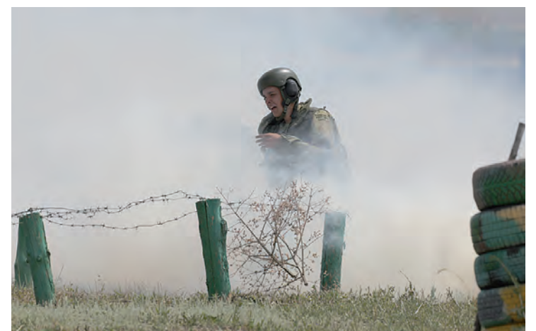
На полосе препятствий