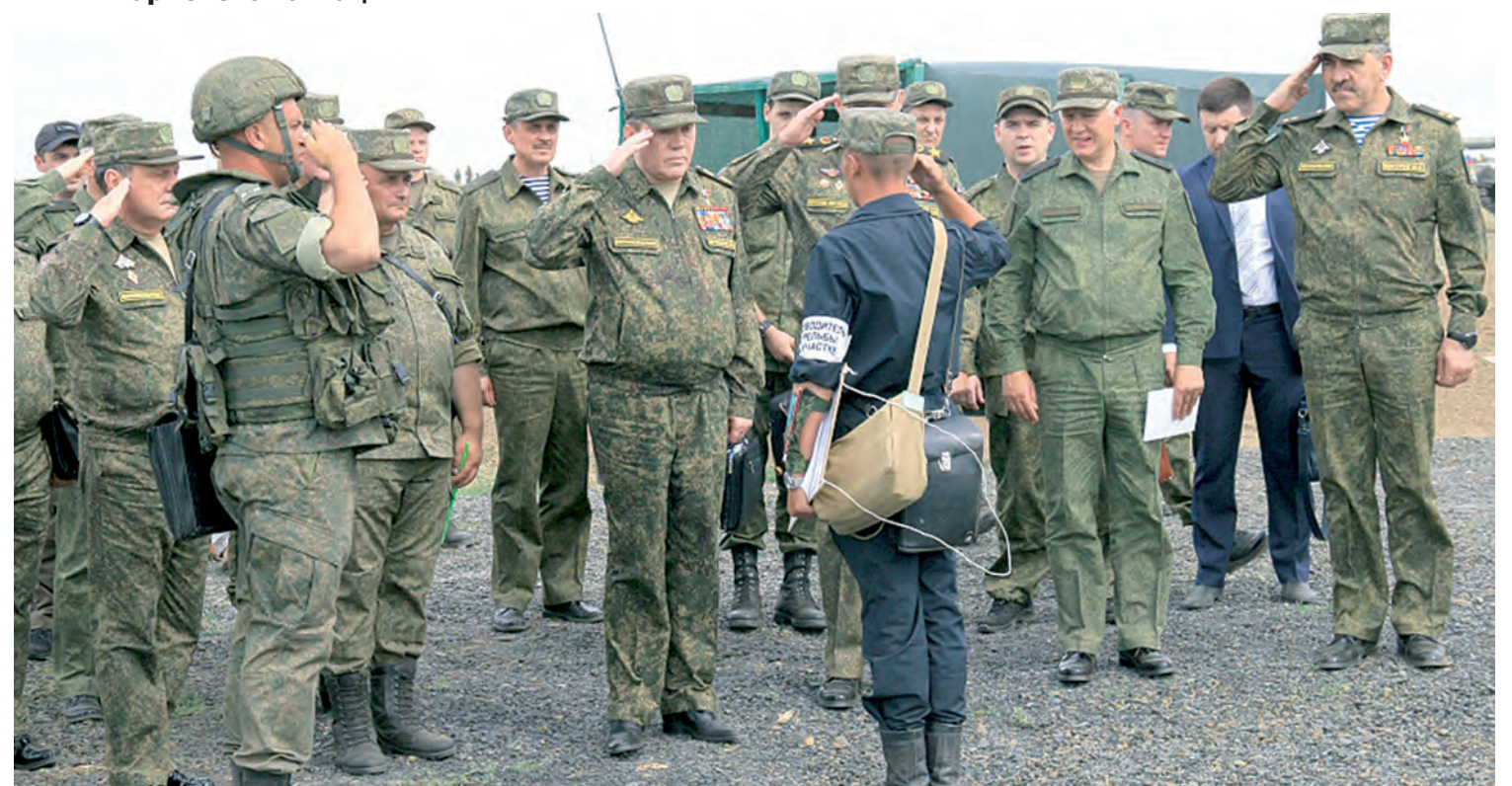
Доклад о выполнении поставленных задач.