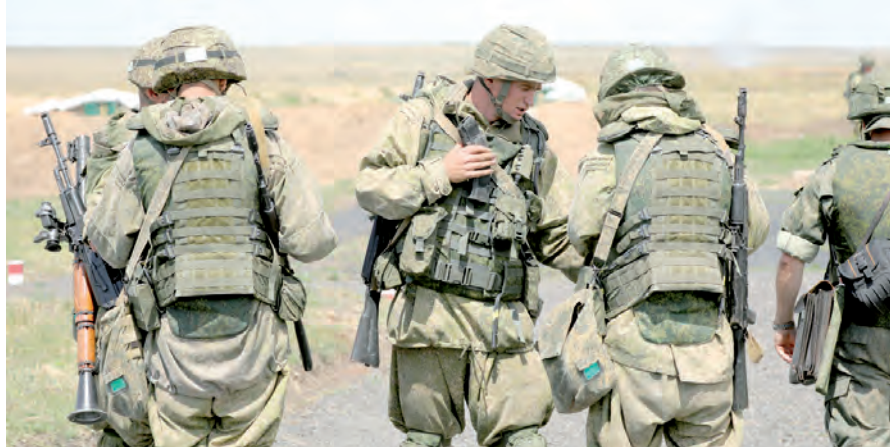
Проверка готовности к выполнению контрольного упражнения на исходном рубеже.