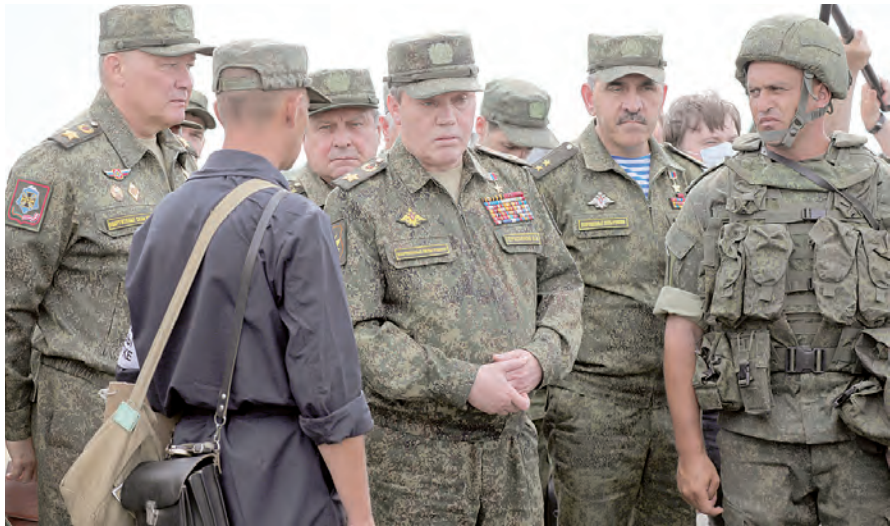
Разговор руководителя контрольного занятия и начальника Генштаба - 1-го заместителя министра обороны РФ Героя России генерала армии Валерия Герасимова.

В соответствии с решением Верховного главнокомандующего Президента РФ, с 17 по 21 июля прошла внезапная проверка войск ЮВО.