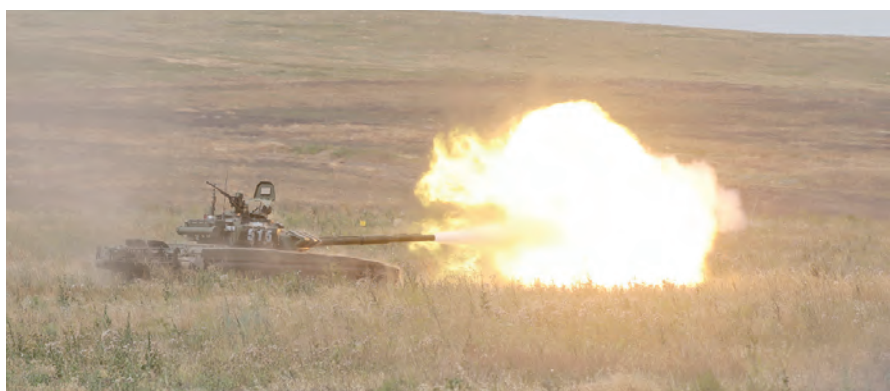
Танки: огонь по выявленным целям.