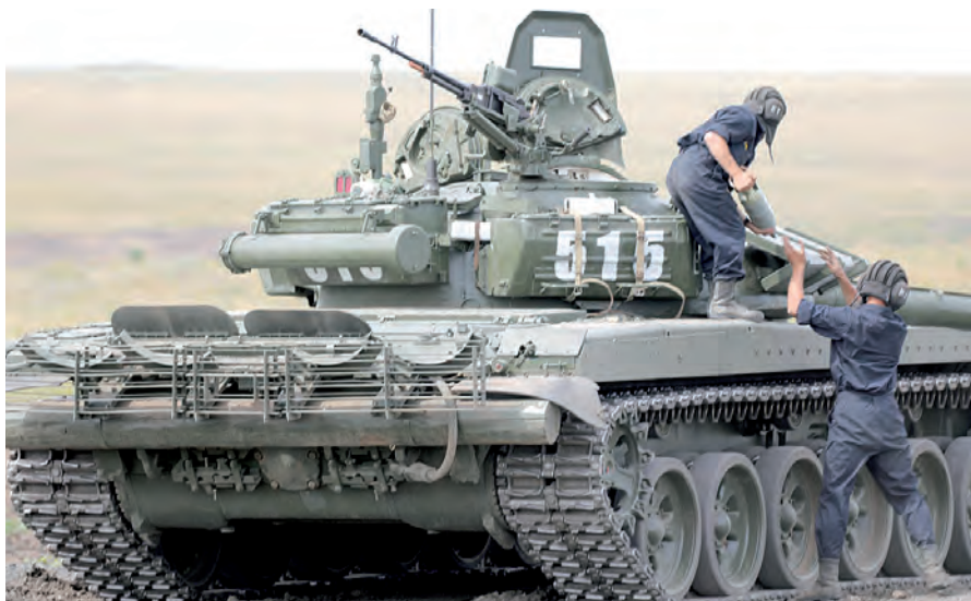
Загрузка боеприпасов - неотъемлемый атрибут занятий у танкистов.