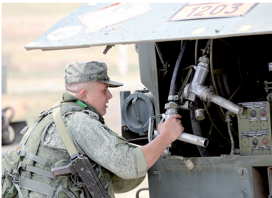
К дозаправке техники готовы!