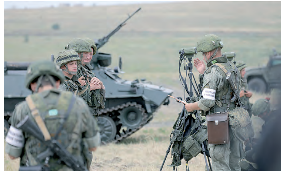
Постановка учебно-боевой задачи.