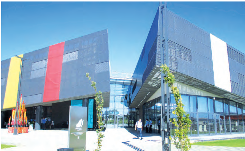
Воздвигнут мощный современный комплекс.