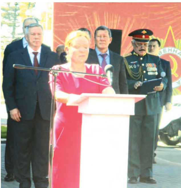
В церемонии открытия комплекса «Самбекские высоты» участвовала и министр культуры России Ольга Любимова.