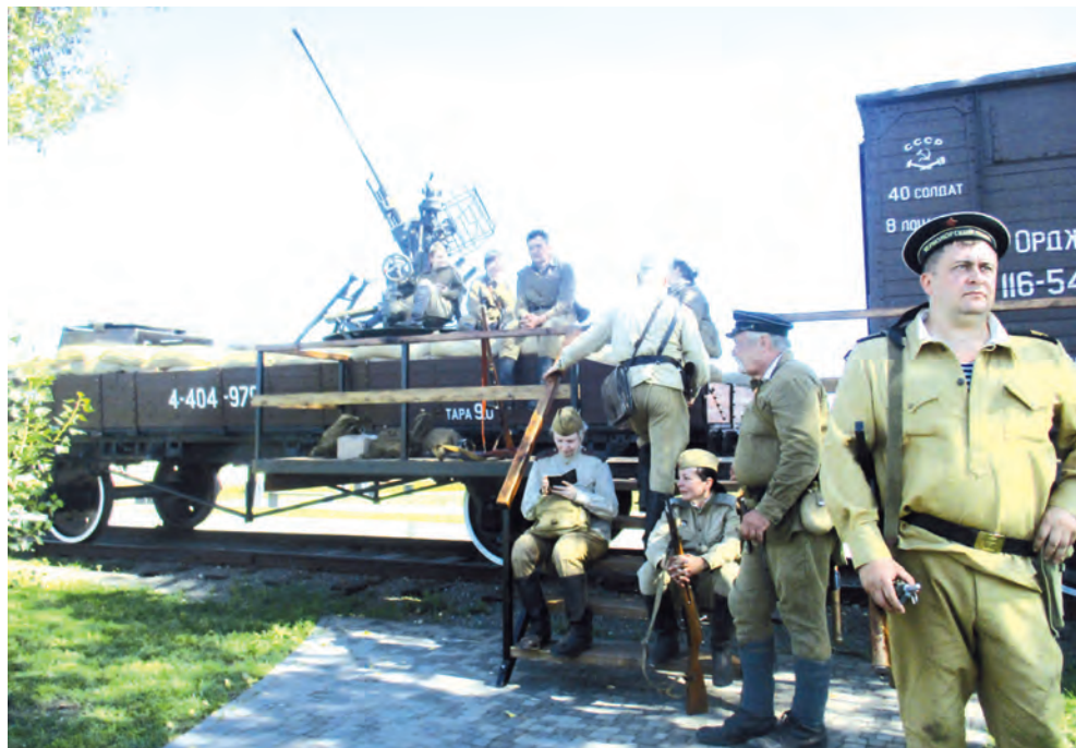
Реконструкторы в ожидании начала «боя».