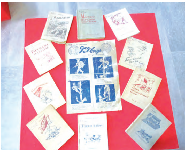
В музее нашлось место даже для печатной продукции фронтовой поры.