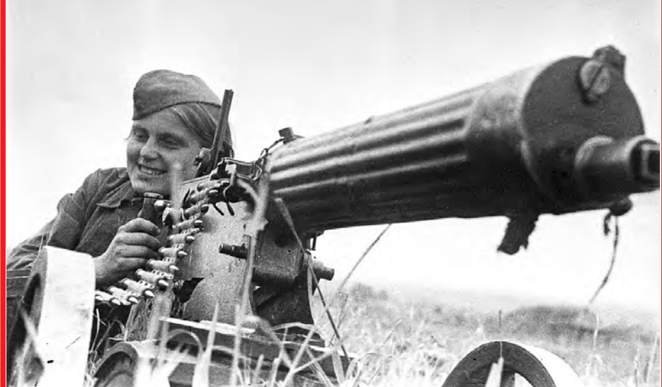
Катюша и «максим»