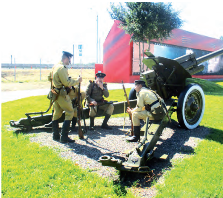
У наших артиллеристов-реконструкторов перекур.