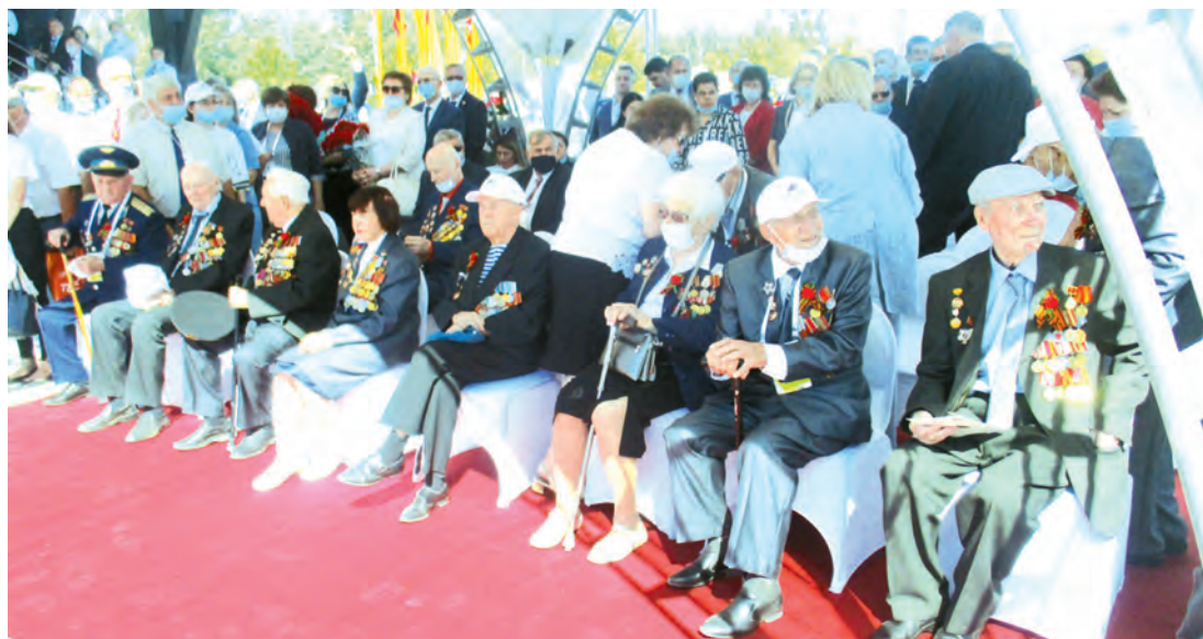
Фронтовики - главные гости праздника. Именно по их инициативе на Самбеке возник музейный комплекс.

Владимир Путин направил приветственную телеграмму участникам торжественной церемонии открытия Народного военно-исторического музейного комплекса «Самбекские высоты» и пожелал мемориалу успеха в работе по сохранению исторической памяти.