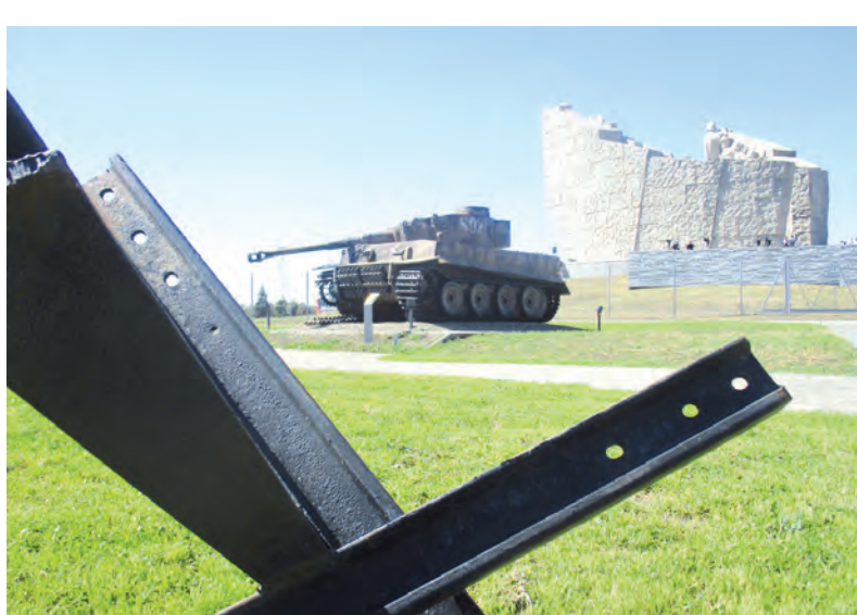
Экспозиция «Самбекских высот» впечатляет. Словно бой закончился вчера.