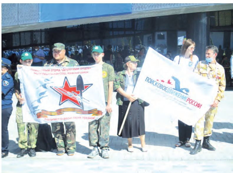
Приехали на Самбек и представители многих поисковых отрядов.