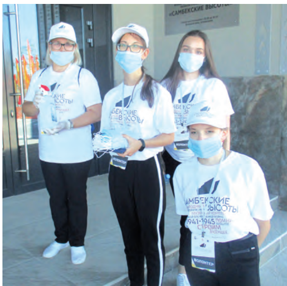
Волонтеры трудились, как пчёлки. Спасибо им за работу!