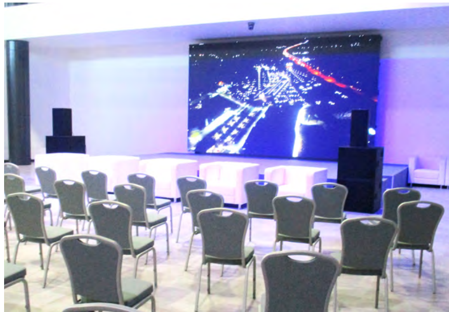
На Самбеке даже конференц-зал появился.