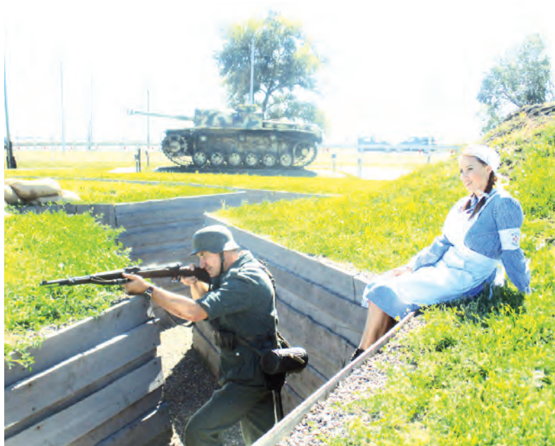
До начала реконструкции «боя» ещё есть время, поэтому «немец» и «советская медсестра» мирно уживаются рядом.

Все площадки музея одновременно смогут посещать более трёх тысяч человек ежедневно.