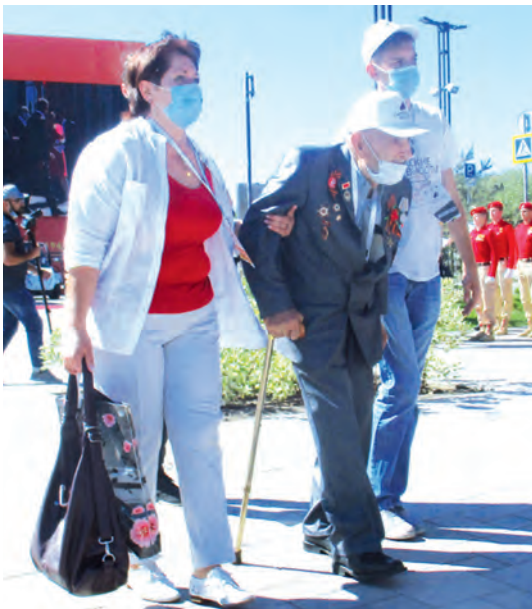
Ветеранам войны помогают волонтеры.