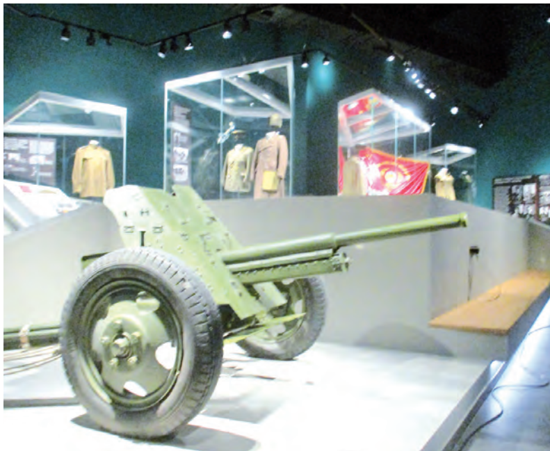
Залов в музее много. Вот так выглядит один из них.