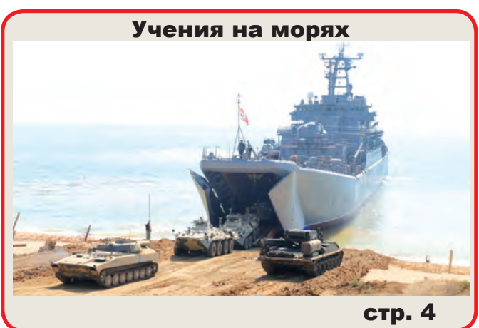
Учения на морях

Победители определялись на каждом этапе и конкурсе в целом в двух категориях - среди военнослужащих-мужчин и военнослужащих-женщин. Итоговые места участников конкурса определялись по наименьшей сумме мест, полученных на каждом его