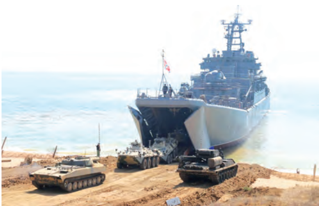
Во взаимодействии с береговыми подразделениями огневого поражения силам морского десанта нанесли самолёты оперативно-тактического авиационного объединения ВВС и ПВО Южного военного округа.

В учении было задействовано порядка 20 кораблей и судов обеспечения, около 200 единиц военной и специальной техники, более 20 самолётов и вертолётов морской авиации Черноморского флота.