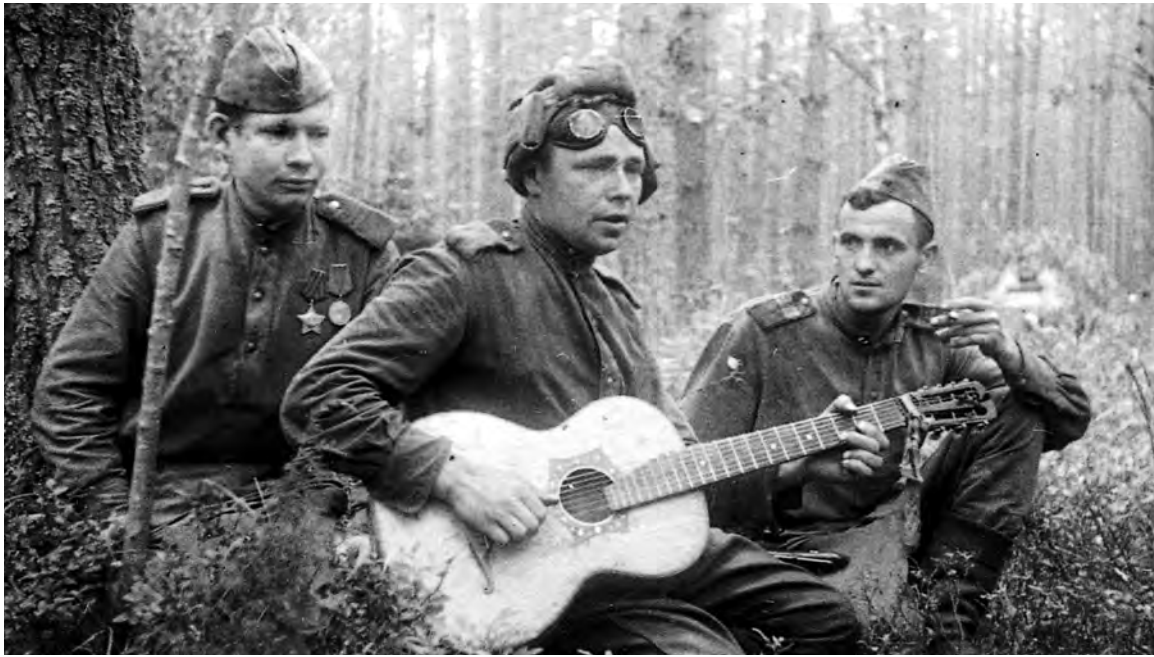
Как ни странно, в дни войны есть минуты тишины...