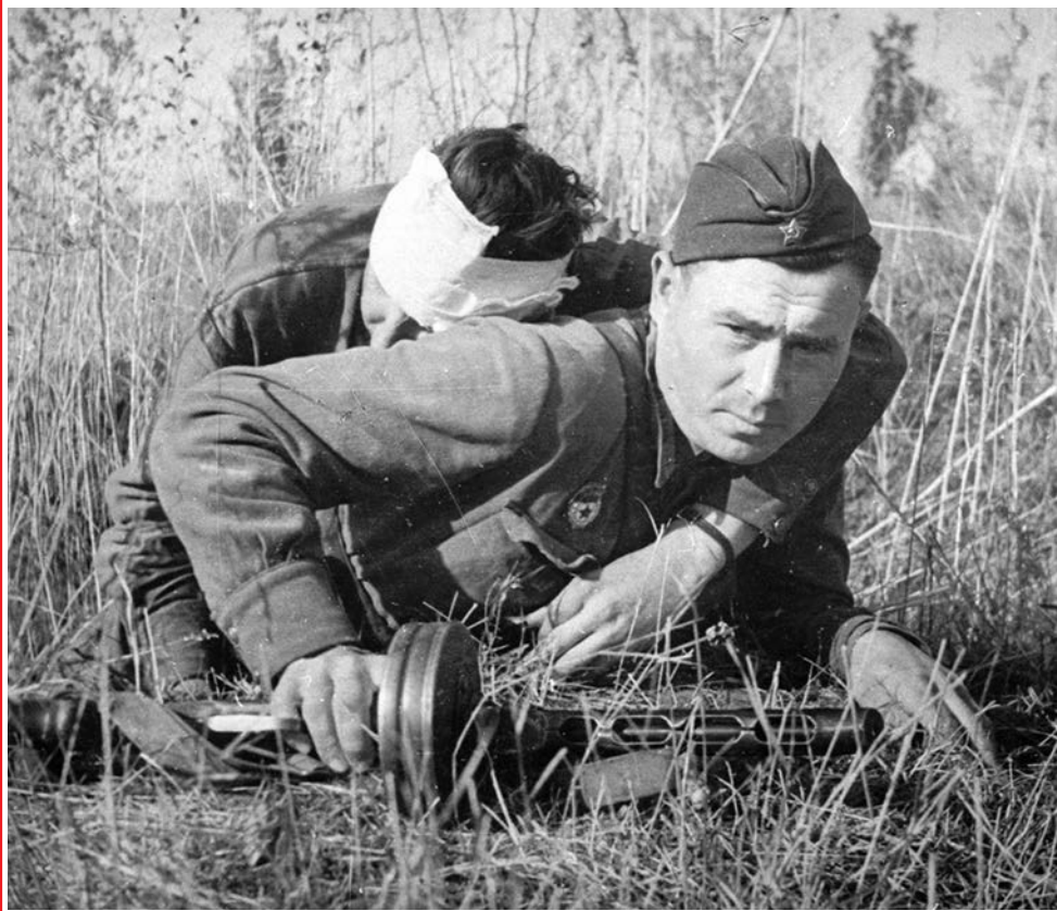
Потерпи, браток, ещё немного...