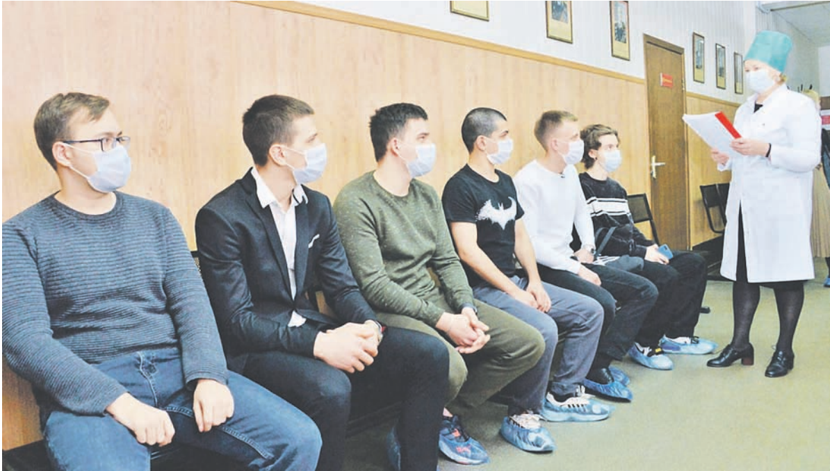
Фото из архива крайвоенкомата

персонал сборного пункта края и призывники были обеспечены индивидуальными средствами защиты: масками, перчатками и дезинфицирующими гелями.