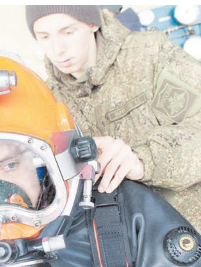
Подготовка к погружению

вали команды всем необходимым – отличным водолажным снаряжением СВУ-5, воздухом, специальной техникой, страховочным оборудованием и так далее. Все