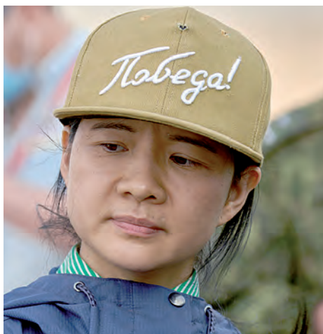
Политические взгляды у китайской журналистки, как говорится, на лбу написаны.