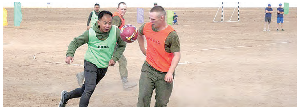
Футбольный матч между друзьями по оружию: Мьянма против Белоруссии. Счёт не важен.