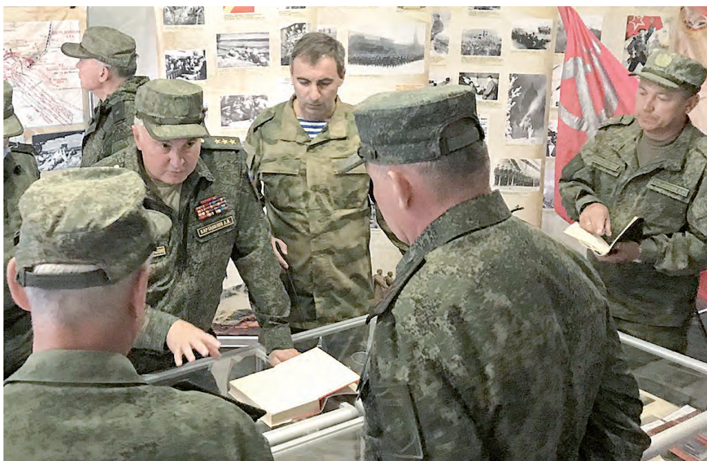
Совещание накоротке проводит заместитель министра обороны РФ - начальник Главного военно-политического управления ВС РФ генерал-полковник А. Картаполов.