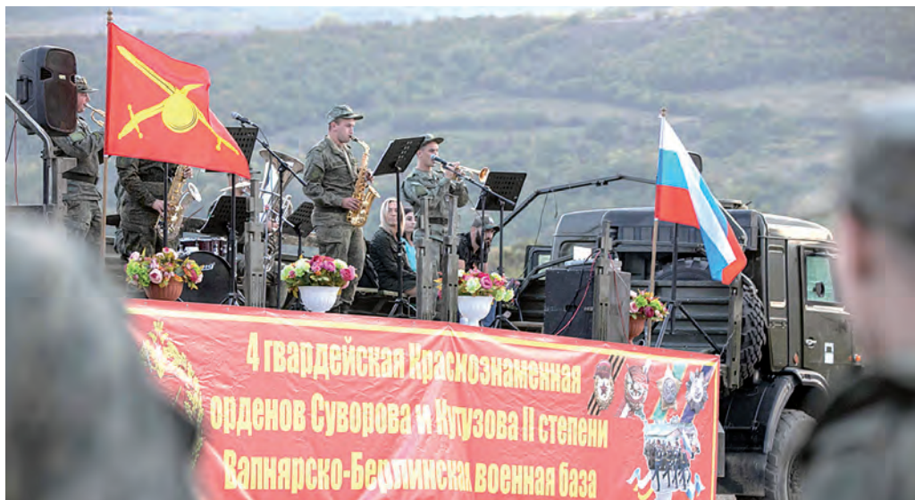
Концерт творческих коллективов военной базы из Абхазии.

Закончилось широкомасштабное учение войск Южного военного округа. Армия и флот продемонстрировали свои силу и возможности оберегать мир на Юго-Западном стратегическом направлении.