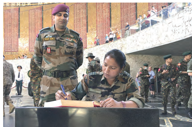
На Мамаевом кургане военнослужащие дружественных армий оставили свои отзывы.