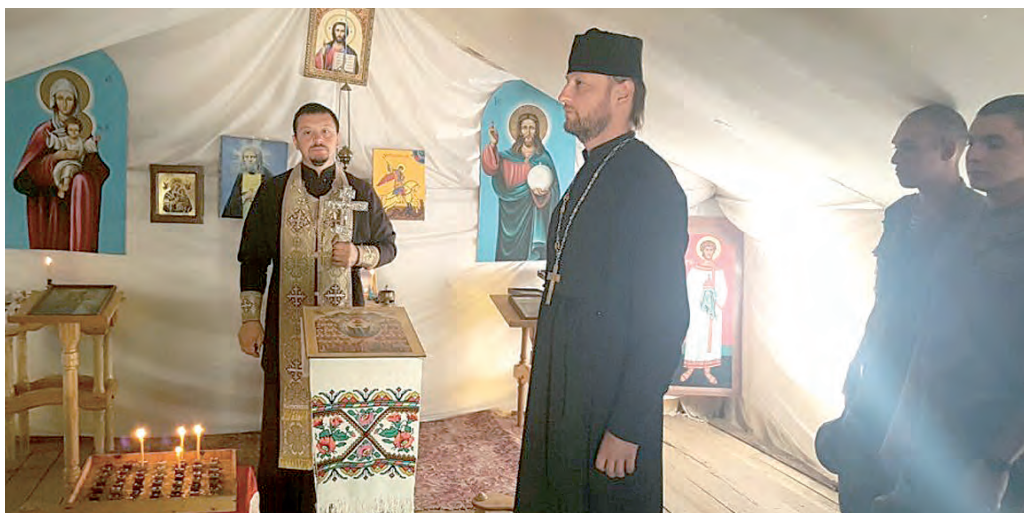
Перед очередным этапом манёвров военные священники отслужили молебен.