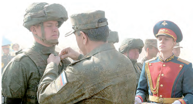
Спасибо за выучку! Отличившихся в ходе СКШУ военнослужащих награждает заместитель министра обороны РФ генерал-лейтенант Ю.-Б. Евкуров.