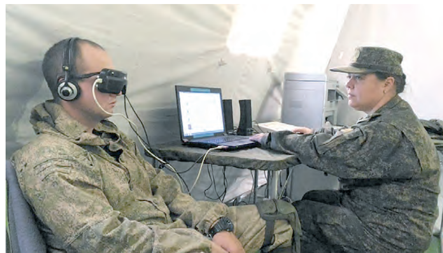
Психологическое здоровье участников учения под контролем специалистов.