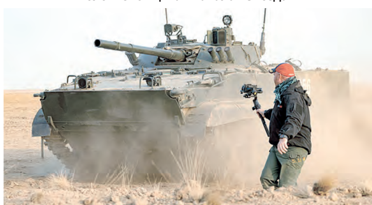
Ради хорошей картинки оператор TV готов рисковать.