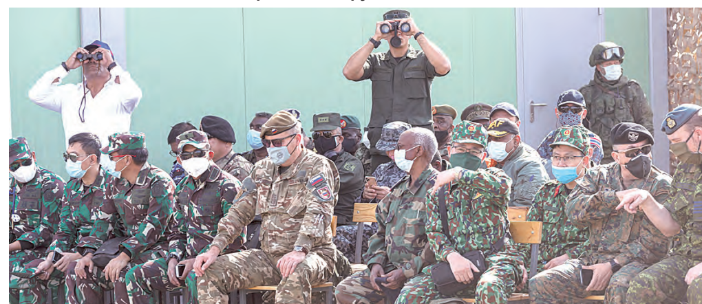
Около 70 стран прислали своих военных атташе посмотреть мощь созданной на Юге России военной коалиции.