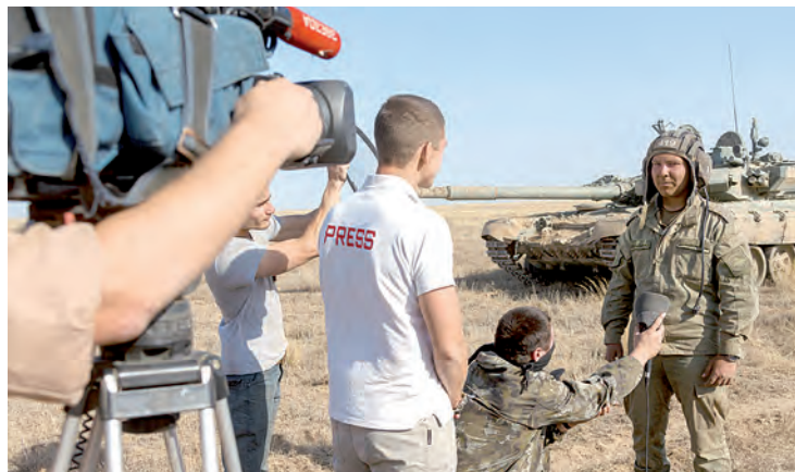
Своё первое в жизни интервью командир танка дал телевизионщикам канала «Звезда».