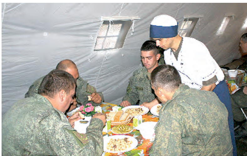
Война войной, а обед по расписанию.