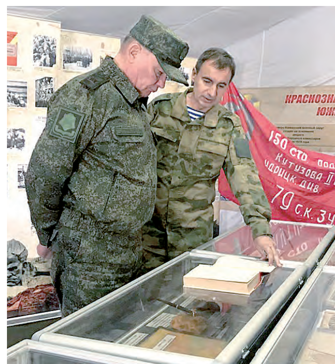
Командующий войсками ЮВО генерал армии А. Дворников знакомится с экспозицией полевого музея боевой славы.