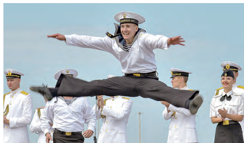
«Эх, яблочко!» Своё мастерство для участников учения демонстрирует Ансамбль песни и пляски ЧФ.