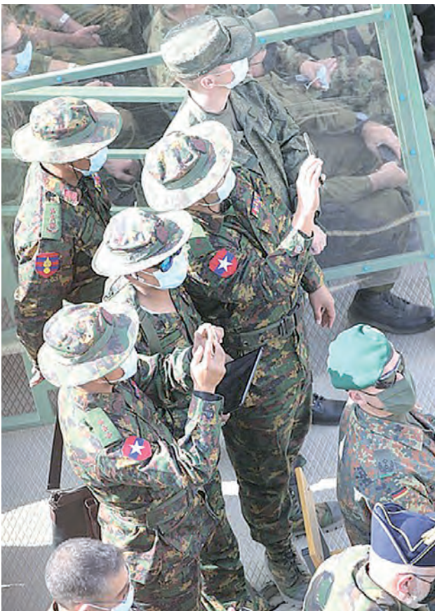
За происходящими событиями на поле боя внимательно следили иностранные наблюдатели.