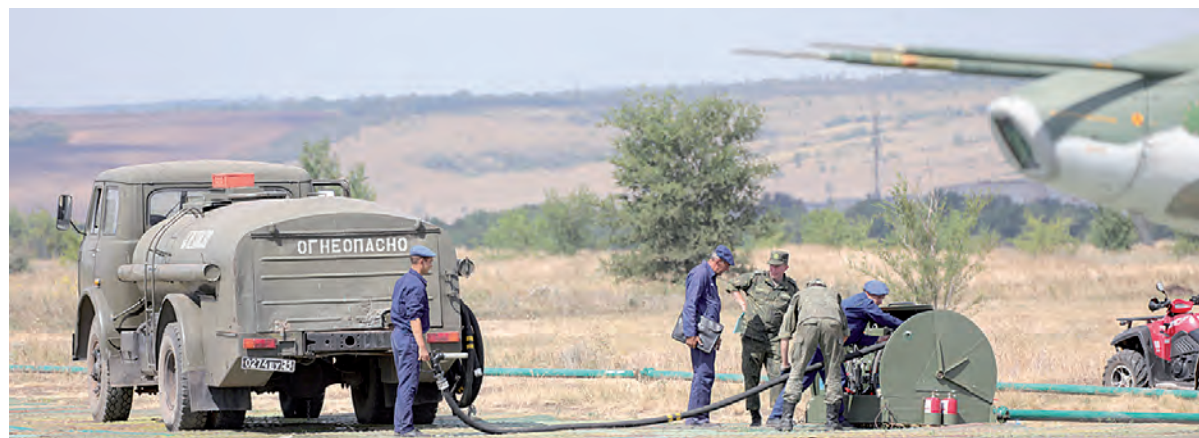
Без специалистов МТО не обойтись.