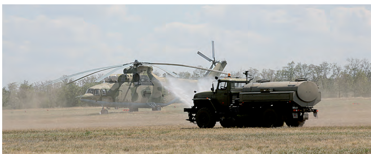
Пожарная машина успевает хоть чуть-чуть прибить пыль водой.