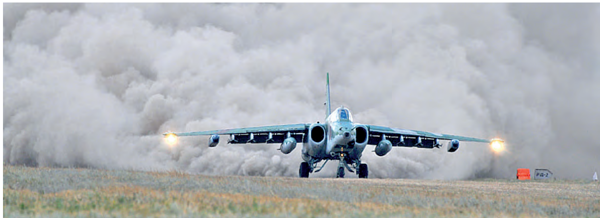
Стена пыли - показатель и взлёта, и посадки.