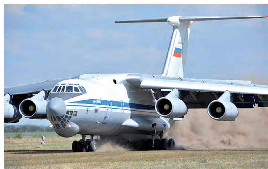
И даже такой слон, как Ил-76МД, сумел сесть в чистом поле!