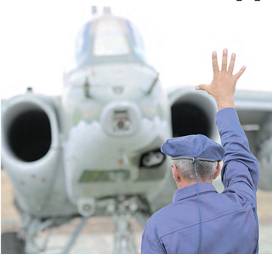
Стоп! Глуши мотор!

На спецучении МТО специалисты ЮВО оборудовали грунтовые аэродромы, чтобы на них могли приземляться самолёты армейской, транспортной и штурмовой авиации.