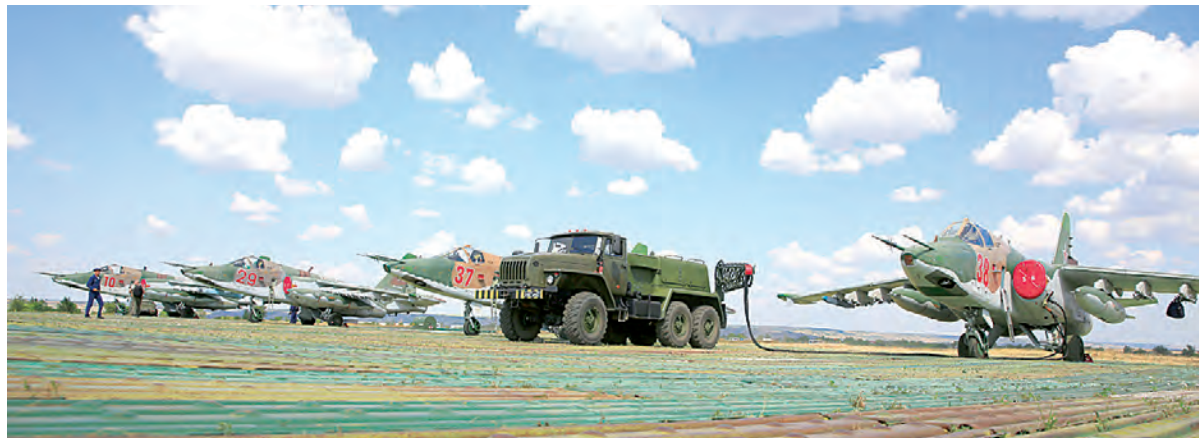
На полевом аэродроме без промедления готовят боевые машины к вылету.