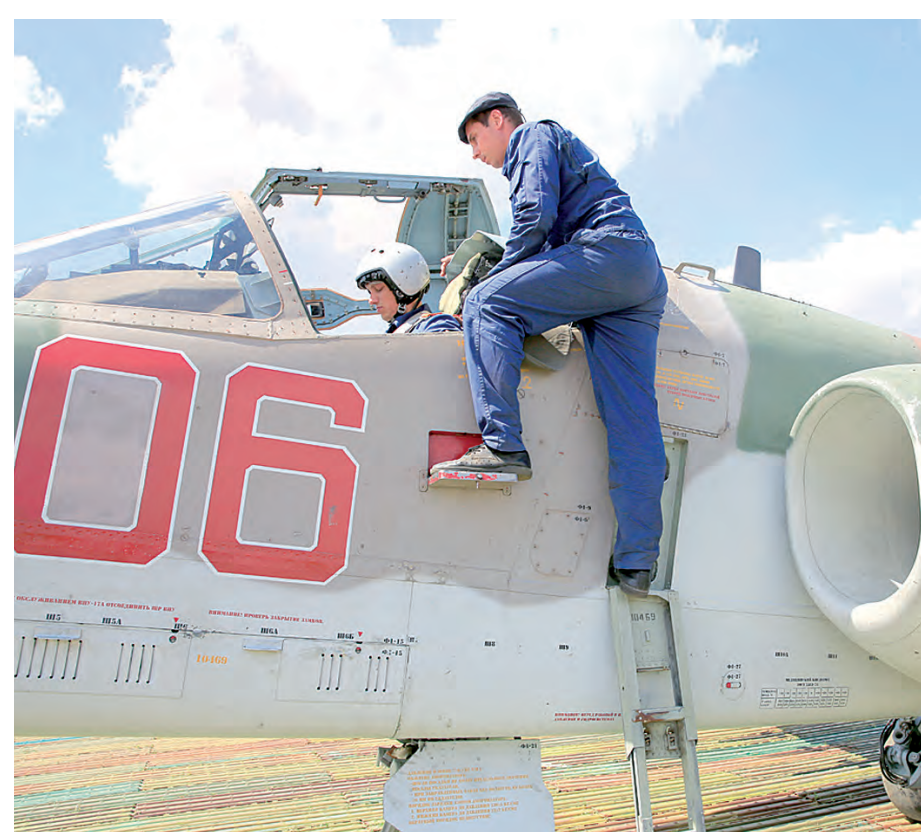
- Как аппарат, командир? - Без сбоев.