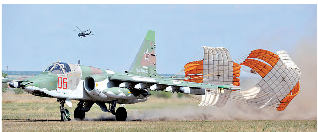
Су-25 («Грач») - идеальный штурмовик для непосредственной поддержки Сухопутных войск.