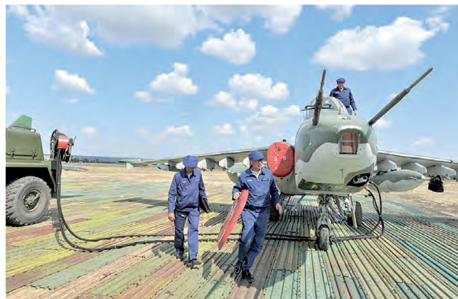
Горячее - кровь машин.