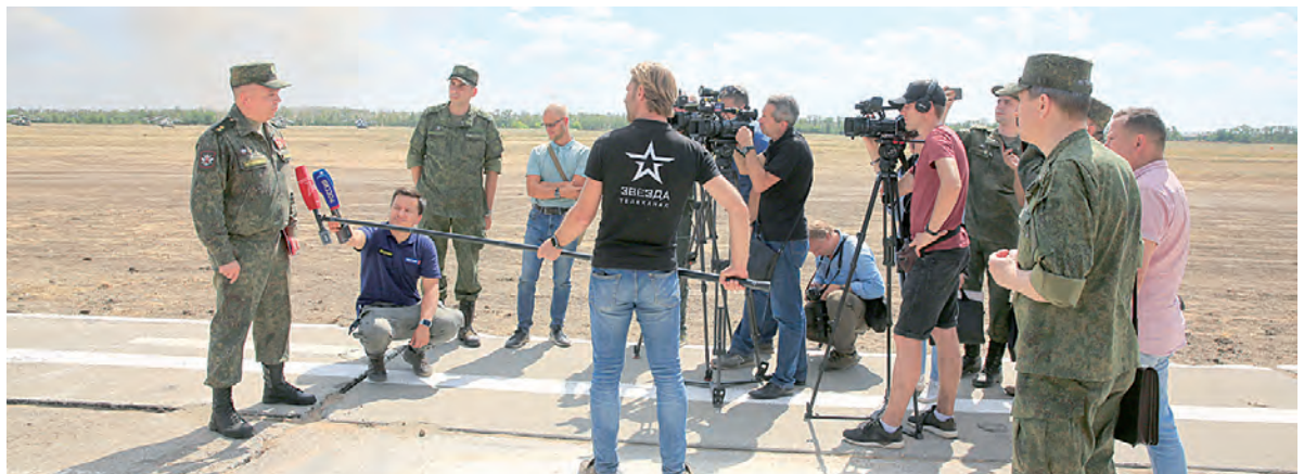
Пресс-конференция на взлётке: отчёт о проделанной работе.