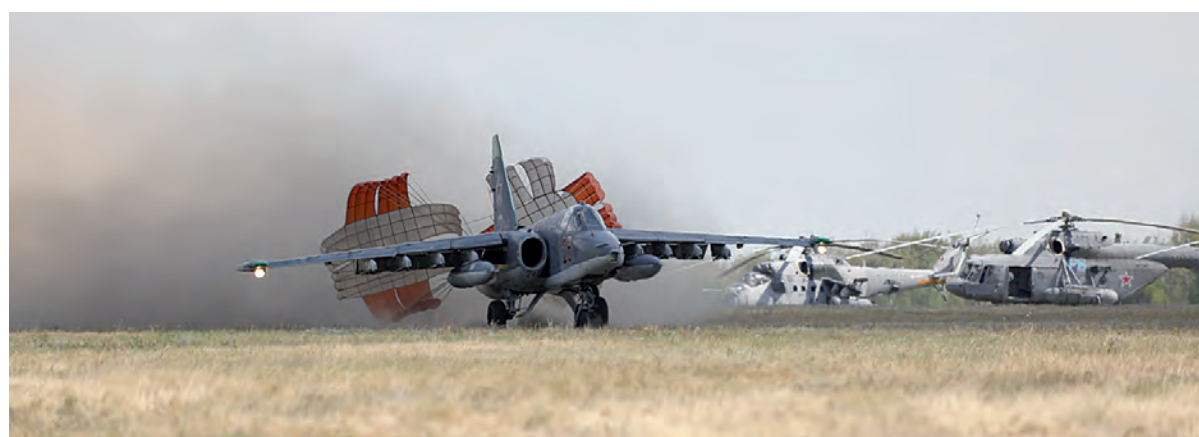
Посадка на грунтовое покрытие требует мастерства.