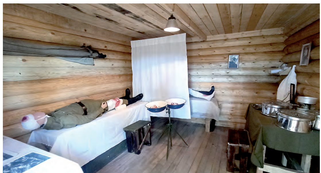
Вот так выглядел полевой лазарет.