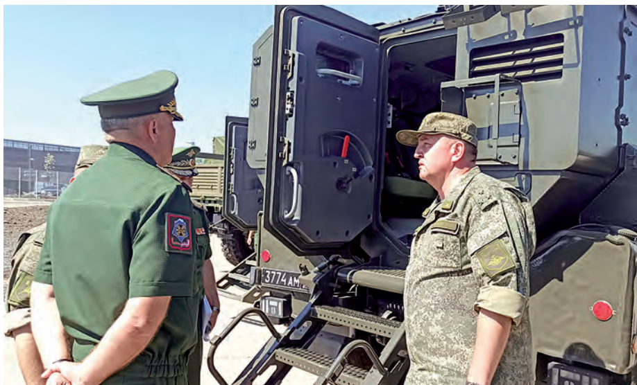
Доклад о возможностях новой техники.