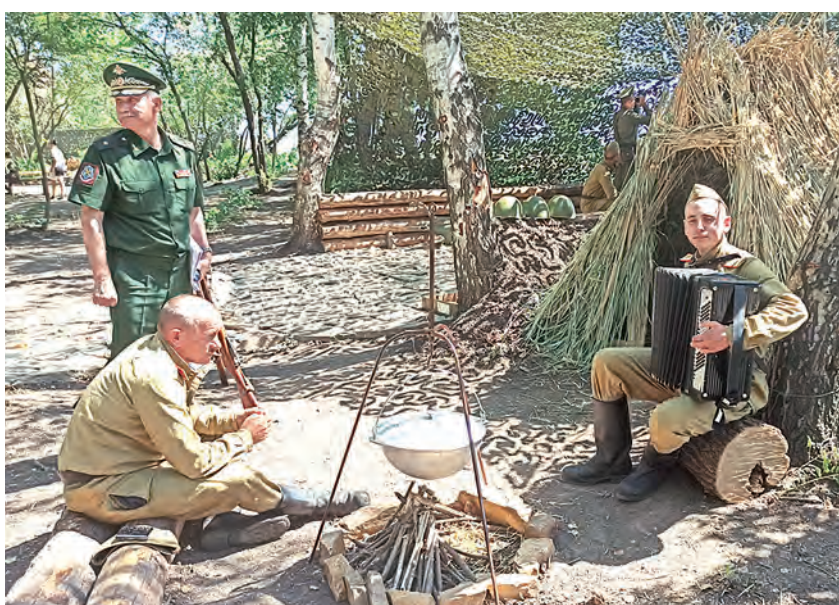
Куда без песни на войне!