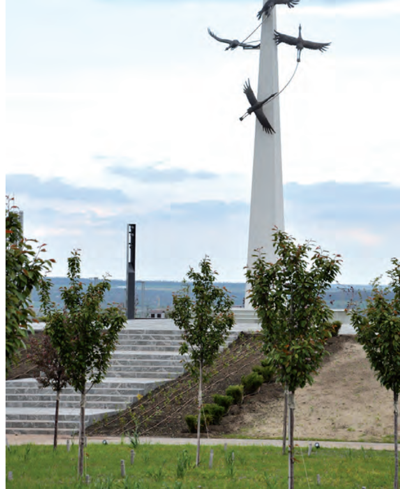
Новый памятник погибшим бойцам на Миус-фронте.

Выставочные мероприятия МВТФ ЮВО «Армия-2020» будут проведены в период с 27 по 29 августа с соблюдением всех санитарно-противоэпидемических мер. При входе на территорию форума всех посетителей обеспечат защитными масками, а на всех точках общепита предложат средство для обработки рук - санитайзер.