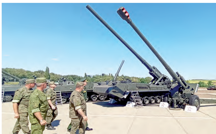
«Боги войны» - современная артиллерия.