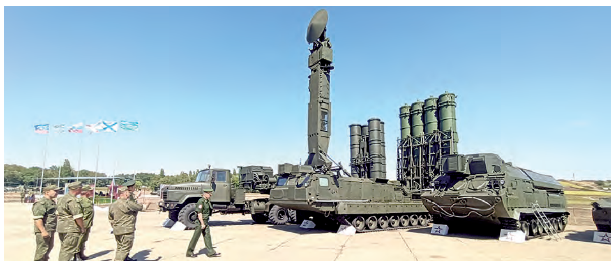
Защитники неба - комплексы ПВО С-300 и С-400.