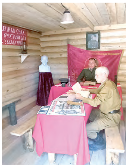
«Ленинская комната» в партизанском лагере.