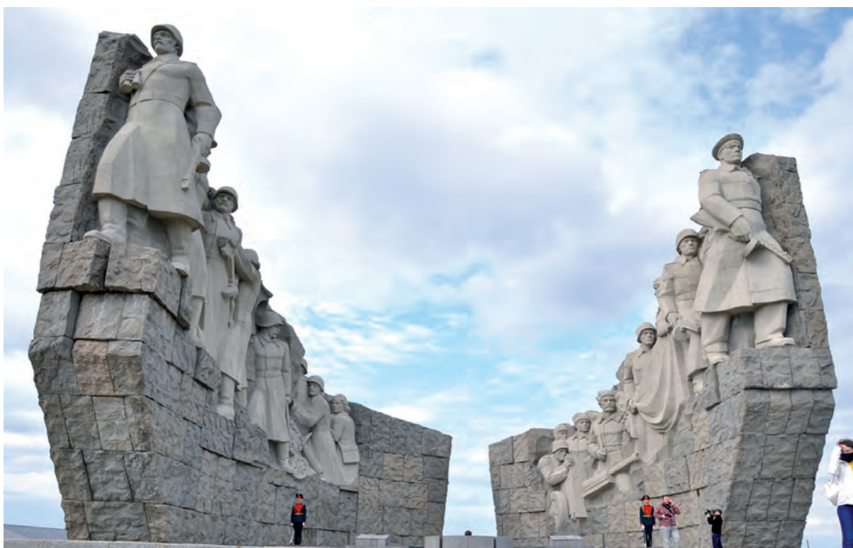
Центральный монумент мемориала на Самбекских высотах.

На «Самбекских высотах» зрителям и гостям форума продемонстрируют «партизанскую деревню» оборудованную в лесном массиве. Экскурсанта увидят штаб, замаскированные огневые позиции артиллерийских орудий, полосы препятствий, площадки с мишенями для метания ножей, места для проживания и питания «партизан», а также медпункт, шалаши и землянки.