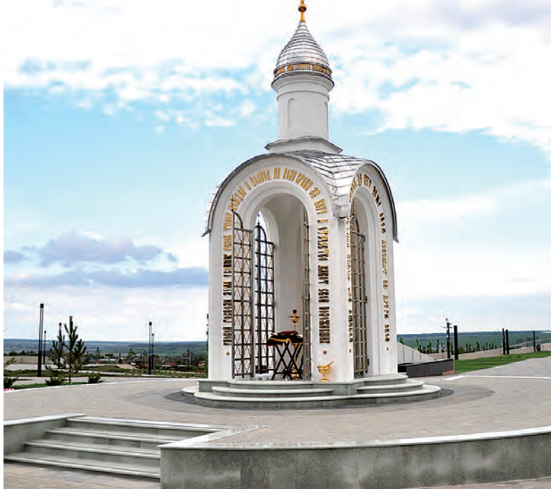
Часовня - место для молитв и поминовения павших.

Второй год подряд центром проведения Международного военно-технического форума (МВТФ) «Армия-2020» в Южном военном округе станет военно-исторический музейный комплекс «Самбекские высоты» в Ростовской области.