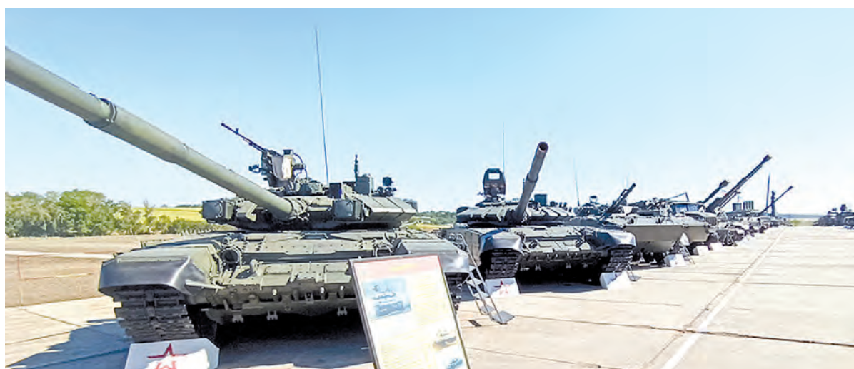
Главная ударная сила сухопутных войск - бронетехника сегодняшнего дня.