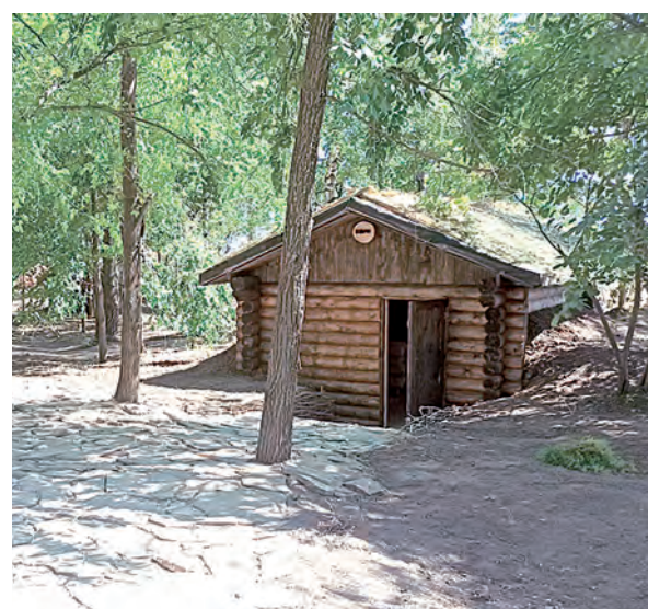
Избушка в партизанском отряде.