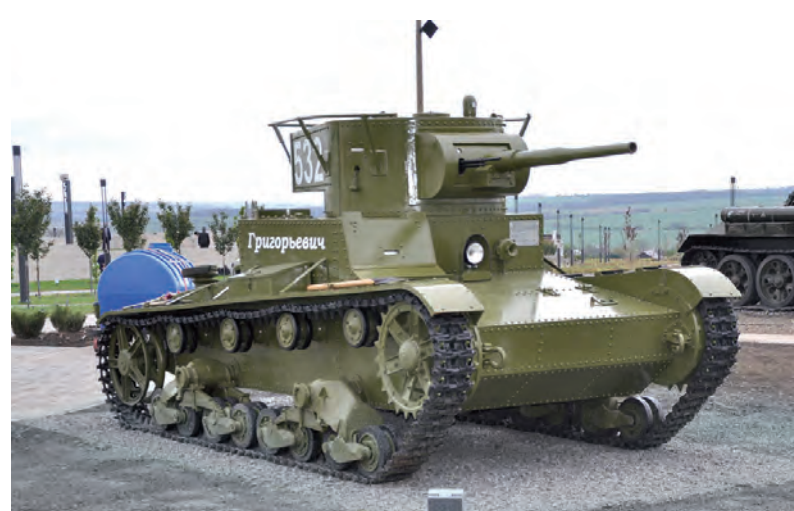
Свидетель истории - именной танк Т-26.

Александр АСТАШЕВ