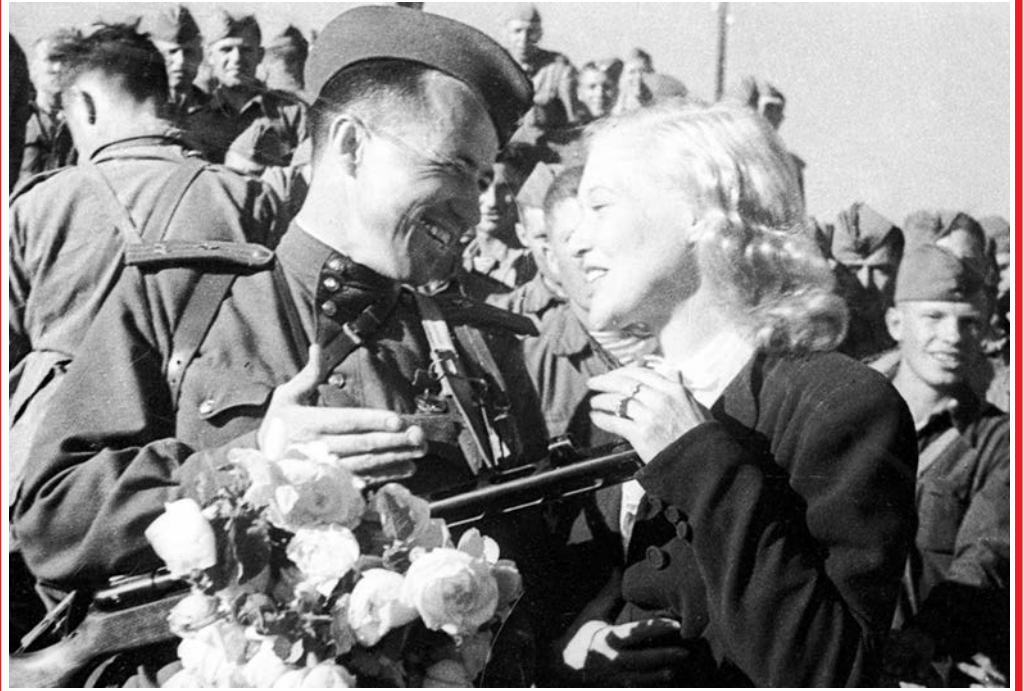
Долгожданная встреча с артисткой.