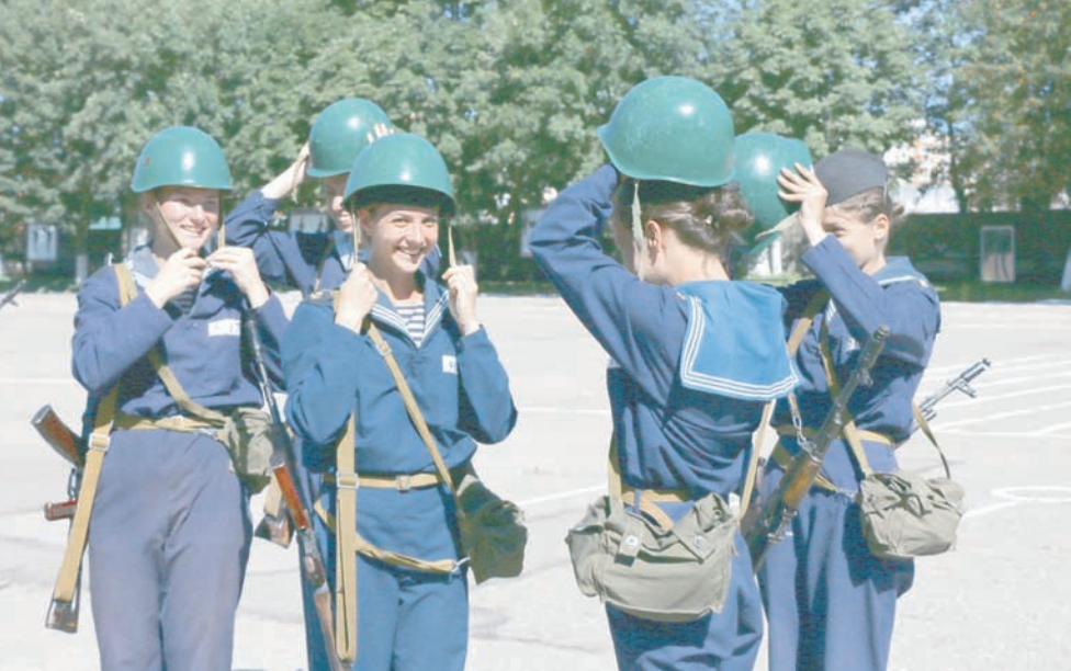
На этапе начальной военно-морской подготовки.

Участие во Всеармейской олимпиаде по математике, которая проходила в Пензе, золото регаты «Миля «Витязя», погружение с аквалангом, управление кораблём на тренажёре «Мостик», экзамены, будни и праздники – пять лет в филиале Военно-морской академии оставили море ярких воспоминаний.