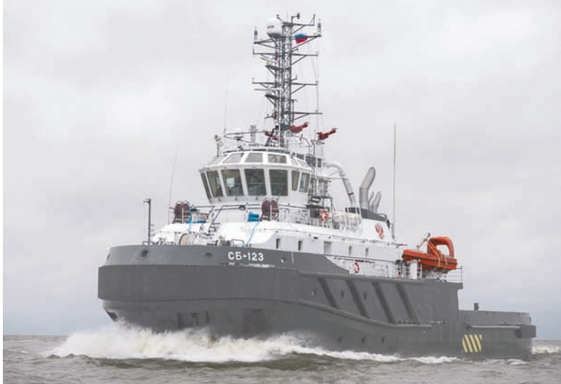
«СБ-123» в море.