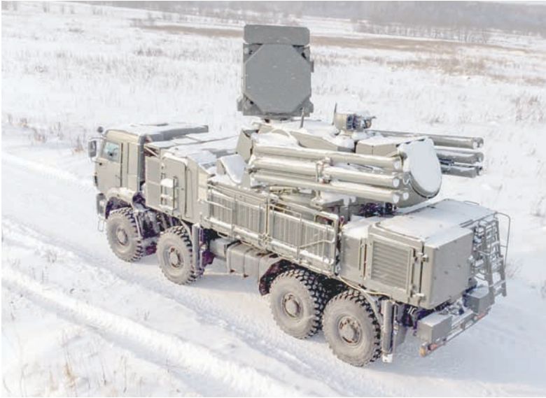
ЗРПК «Панцирь» на марше.

На соревнованиях Центрального федерального округа в Обнинске он проплыл 200 метров вольным стилем за 1 минуту 58 секунд, первым из группы преодолел двухминутный рубеж. Друзья звонили с поздравлениями, восхищались, а соперники завидовали. Ещё более высокий результат на дистанции 100 метров вольным стилем Антон продемонстрировал на чемпионате России по полиатлону – 52,9 секунды.