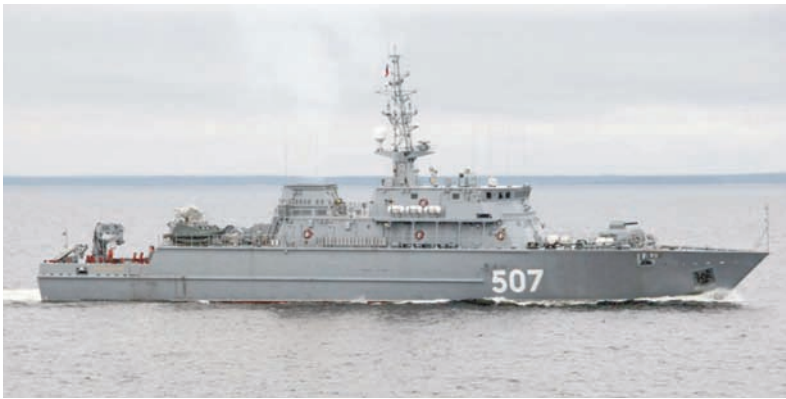
Курсом – в морской полигон.

Родился наш герой в Молдавии. Мать – молдаванка, отец – коми, такое вот смешение севера и юга в одном человеке! Сначала семья жила в Республике Коми, потом переехала в Иваново, где Нику окончил девять классов средней школы и лицей № 18, приобрёл специальность слесаря механосборочных работ – слесаря-ремонтника. Потом уездил на заработки в Москву, трудился где придётся: и системным администратором, и электриком, но постоянного места работы так и не нашёл. Вернулся в Иваново, где, как казалось, встретил девушку своей мечты. Но семейного счастья не получилось. Лекарством от разочарований для 21-летнего юноши стала военная служба. Говорит, как только решились вопросы с гражданством, в 2014 году сразу пошёл в военкомат, заявил, что хотел бы служить по контракту, на что ему ответили: «Сначала хотя бы год прослужика, а там будет видно!»