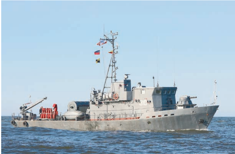
РТ «Леонид Перепеч».

Виктор МАКСИМЕНКО, фото автора и из архива соединения.