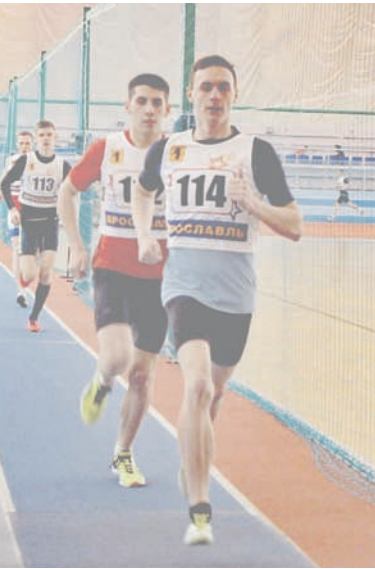
На беговой дорожке.