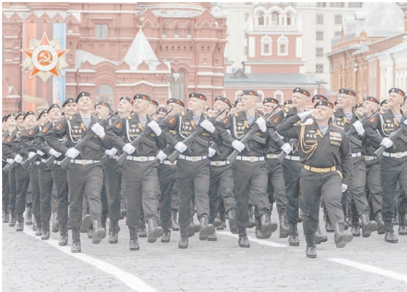
Морские пехотинцы Балтики на параде Победы в Москве.