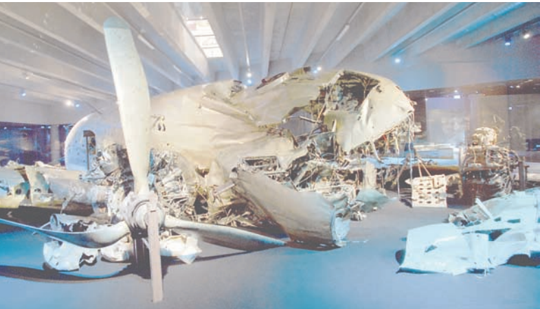
Поднятые со дна Балтики в 2004 году обломки DC-3 в музее ВВС Швеции.

В НАТО исследуют возможность участия женщин в боевых пехотных подразделениях. Научно-техническая организация Альянса недавно завершила крупное исследование, которое показало, что многие страны НАТО и страны-партнёры включают женщин в наземные подразделения ближнего боя, и роль женщин возрастает. Поэтому рекомендовано выявлять передовую практику, собирать фактические данные и обобщать извлечённые уроки для поддержки участия женщин в боевых действиях и лучшего понимания последствий по их интеграции в сухопутные подразделения.