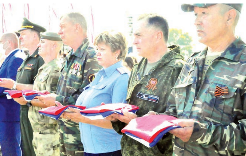
Представители поисковых отрядов Дона с символом государства - Знаменем Российской Федерации.