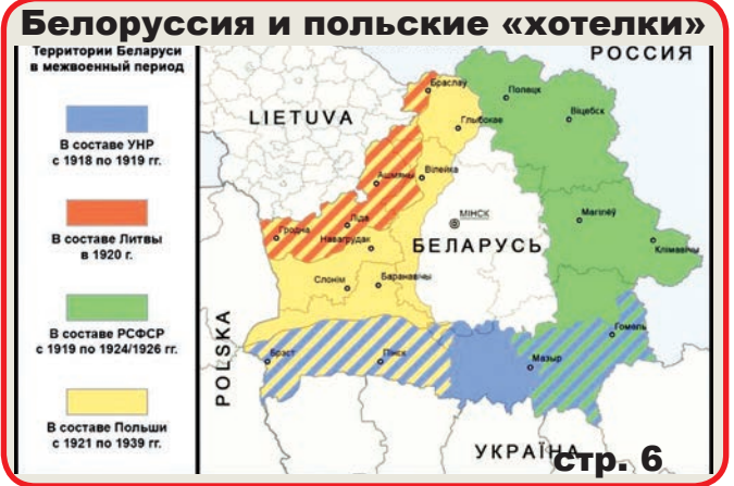
Белоруссия и польские «хотелки»