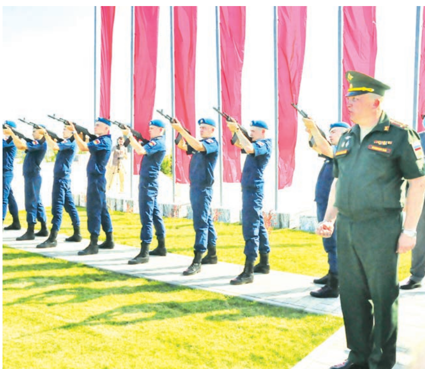
Последний траурный салют...

На территории музейного комплекса «Самбекские высоты» два раза в год проходит церемония захоронения останков воинов Красной армии, найденных поисковиками в ходе раскопок. В последние дни лета земле предали останки 54 военнослужащих.