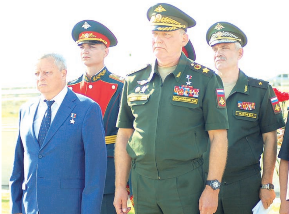
В церемонии перезахоронения павших воинов приняли участие командующий войсками ЮВО генерал армии Александр Дворников, губернатор Ростовской области Василий Голубев и другие официальные лица.