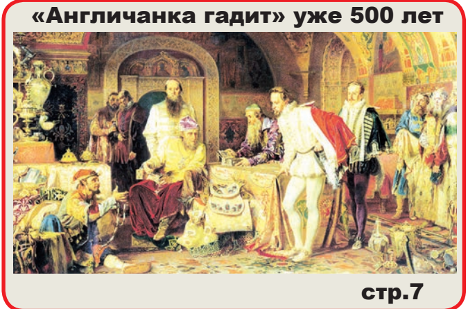
«Англичанка гадит» уже 500 лет