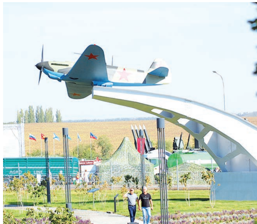
Самолёт лётчика-истребителя Героя Советского Союза Лидии Литвяк занял своё место в экспозиции только в 2020 году.