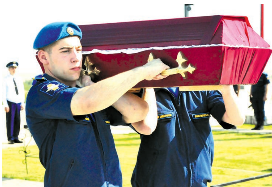
Почётный эскорт. В последний путь...