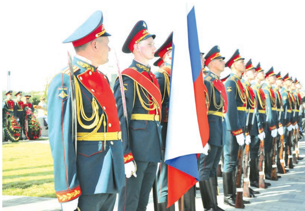
Рота почётного караула Южного военного округа.