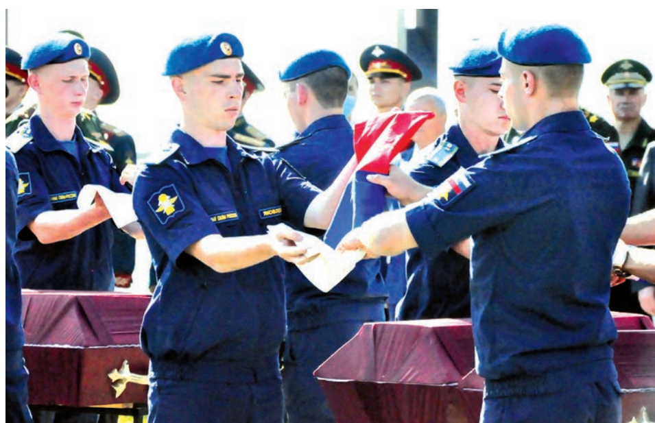
Ритуал складывания государственного флага - это знак глубокого уважения к нему, признание заслуг павших перед Отечеством.