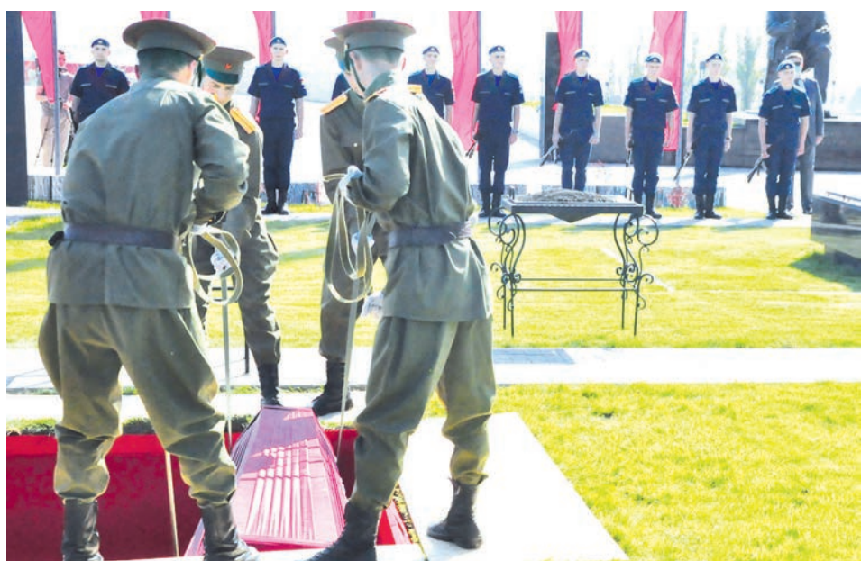
Опускание гроба в братскую могилу под траурный марш оркестра.