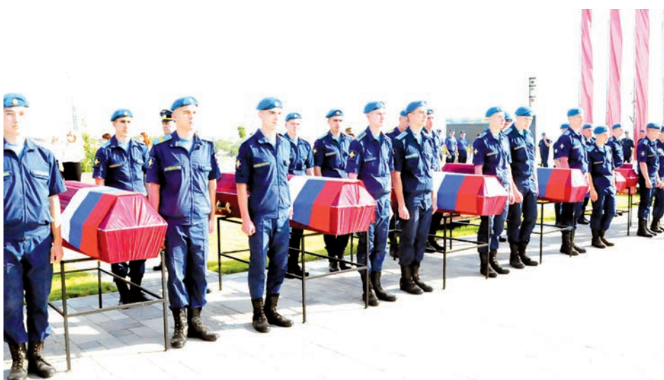
На постаменте останки 54 воинов.